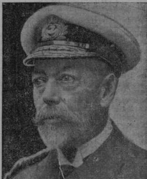
Rajni angleški kralj Jurij V.