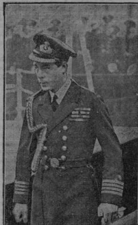
Novi angleški kralj Edvard VIII.

strovo v Leopoldstadtu podružnico madžarske trgovske banke in so bile ubite tri osebe. Prijeti zločinci so priznali roparski napad in so bili enoglasno obsojeni v smrt na vešalih.