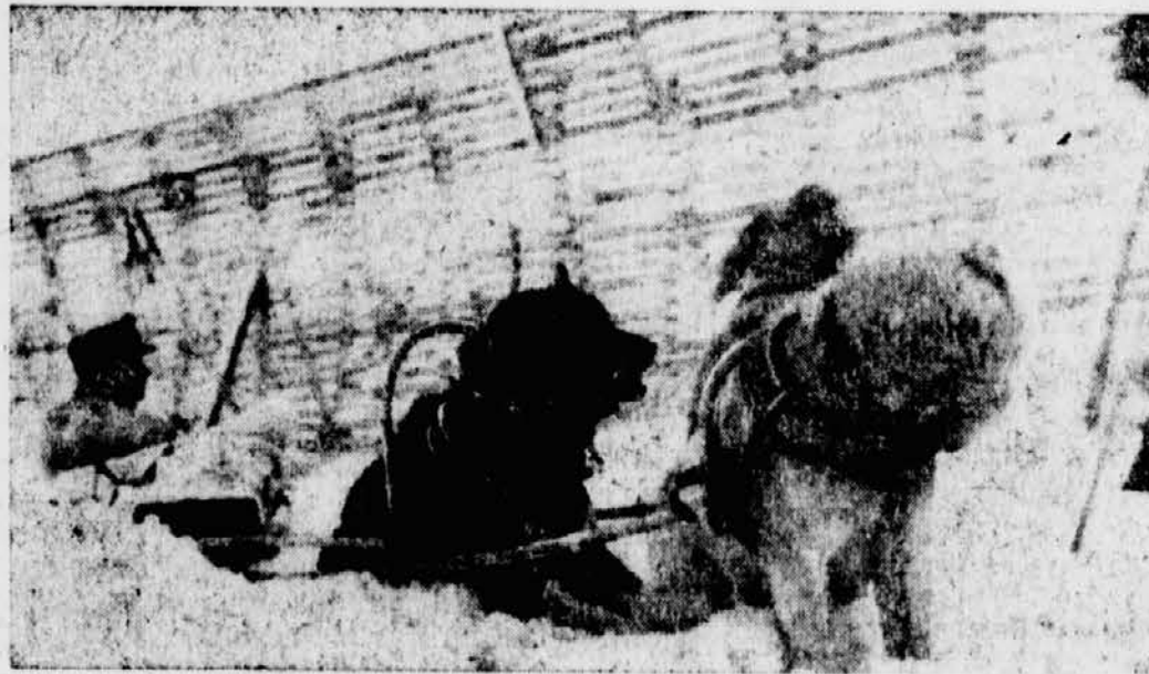
PK.-Kriegsberichterstatter Serr (Sch)

»Schreiben Sie uns bitte einmal Ihre Erlebnisse im Kriege«, bittet Mariechen aus Leoben mit ihren Freundinnen und schließt: »Wie geht es Ihnen sonst? Was macht die Liebe??? Na, wenn das kein Anknüpfungspunkt für tausend Briefseiten und mehr wird...! Ihre