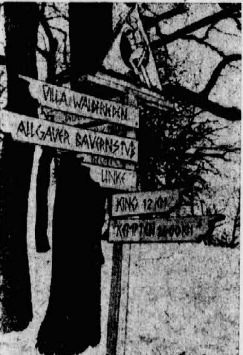
PK.-Aufnahme; Kriegsberichterstatter Lehr (Wb.)

Inge aus München schreibt: »...auch ich möchte, da ich niemand draußen habe, Grüße an einen Soldaten senden!« Und wie Inge berichten auch Hanni aus