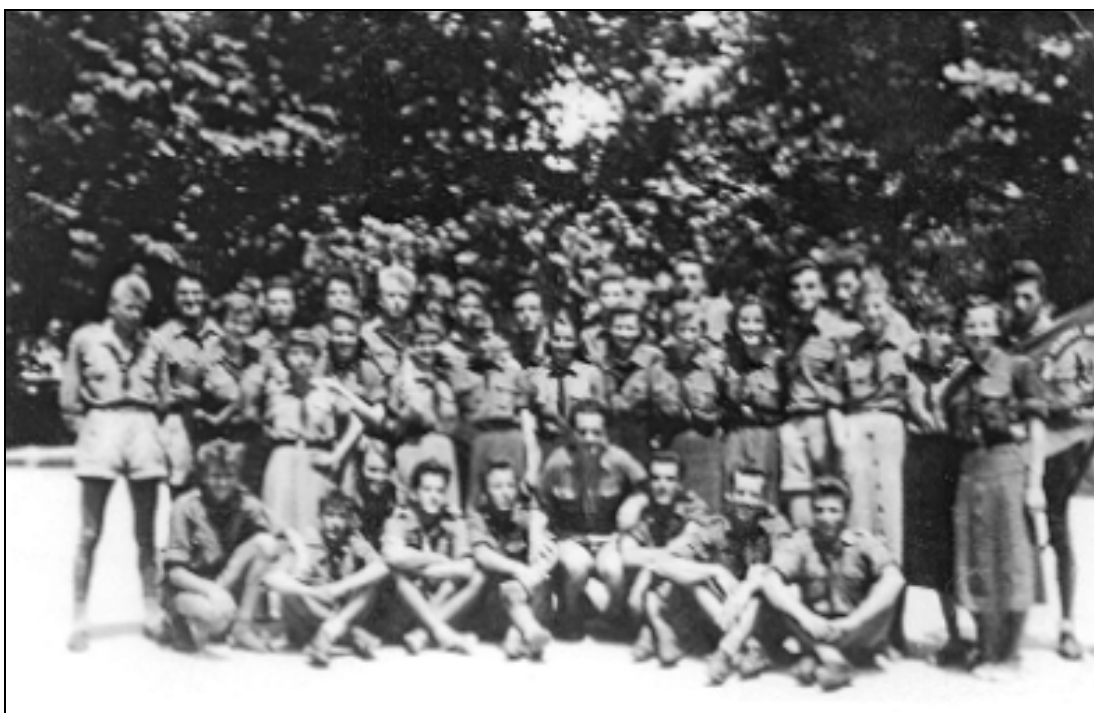
Taborniški zlet v Ljubljani je potekal od 29. junija do 4. julija 1955. Pevski zbor ajdovske gimnazije je nastopal v imenu taborniškega odreda Mladi bori. Za to priložnosti so dobili nove taborniške uniforme, ki so bile hkrati tudi koncertne obleke.