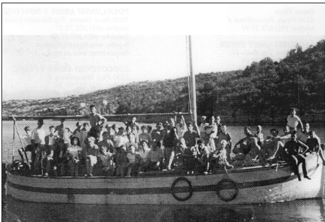
Na taborjenje je odšlo 43 pevcev in pevk. Z njimi sta odpotovali še dve dijakinji, ki nista bili pevki, in en tabornik. Iz Malinske, kjer so postavili svoj tabor, so se do mest, v katerih so imeli nastope, prevažali z manjšimi ladjami in čolni, ki so jih najeli po potrebi.

mladine iz Vidma-Krško, ki so taborili v Malinski in so obogatili program z nekaj zanimivimi točkami. Konec prijetnega večera je prišel za mnoge prehitro in obrazi gostov so proseče gledali v taborno vodstvo, ali bo podaljšalo večer. To pa je ostalo prepričano, da je disciplina dobra lastnost, ki mora biti sveta vsakemu dobremu taborniku, zato večera ni podaljšalo.