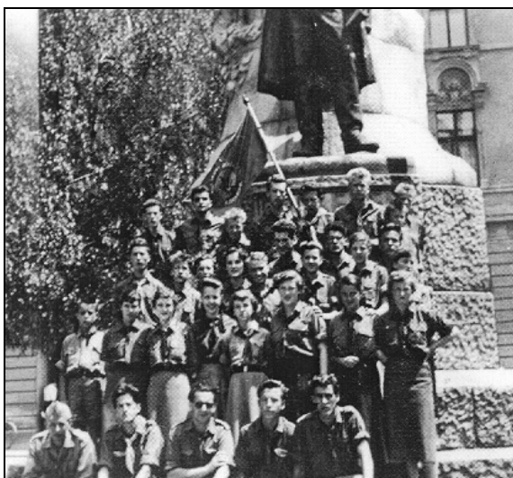
Po končani paradi po ljubljanskih ulicah so pevci ajdovske gimnazije s krajšim nastopom pred spomenikom počastili spomin na Franceta Prešerna.

Načrtovani dnevni red je izgledal takole: vstajanje ob 6.30, nato umivanje, zajtrk ob 7h, takoj za tem pospravljanje šotorov. Ob 8h pevske vaje. Malica ob 10h in do 12.30 kohanje oziroma prosto