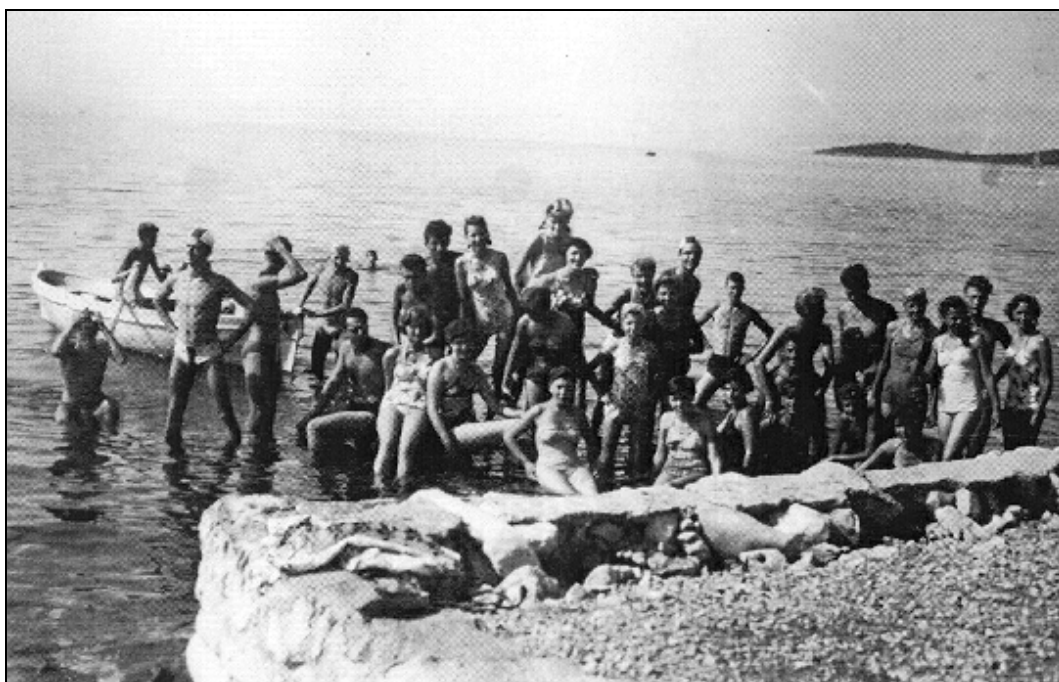
Taborniki so se v prvih letih srečevali tudi z vzgojnimi zadržki staršev, ki svojih hčera niso radi dalj časa puščali brez nadzora, še posebej v družbi z njihovimi vrstniki.