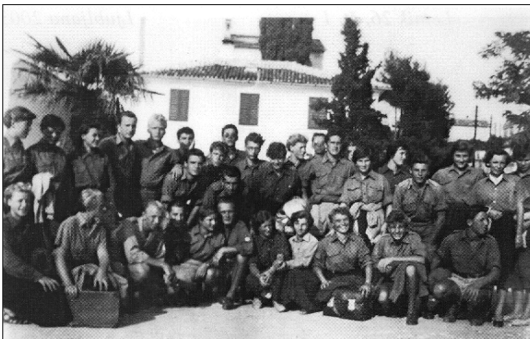
Na turneji po Dalmaciji so ajdovski pevci nastopali v taborniških uniformah, ki so jih dobili za sodelovanje na taborniškem zletu v Ljubljani.

vse minilo brez posledic. Kratko noč so prespali na klopih in se že ob treh zjutraj zbudili, saj so ob štirih z ladjo že odpluli na Reko, kamor so prispeli ob devetih. Ker so imeli dogovorjeno snemanje šele ob pol osmih zvečer, so si čez dan privoščili malo zabave. Zborovodja je dal pevcem in pevkam žepnino za kosilo. Pevke pa so jo raje porabile za sladoleđ, po katerem so jih malo boleli trebuh, hujšega pa ni bilo, razen neobveznega sklepa, da naslednjič ne dobijo več žepnine. Zbor je na Radiu Rijeka posnel 20 minut programa na neobstojni magnetofonski trak. Delavci na radiu so bili nad izvajanjem programa navdušeni in so obljubili, da bodo posnetke prenesli na plošče. Z Matičičem so se dogovorili za ponovno snemanje ob koncu septembra, ko naj bi zbor odpotoval na turnejo v Hercegovino in Črno goro. 31