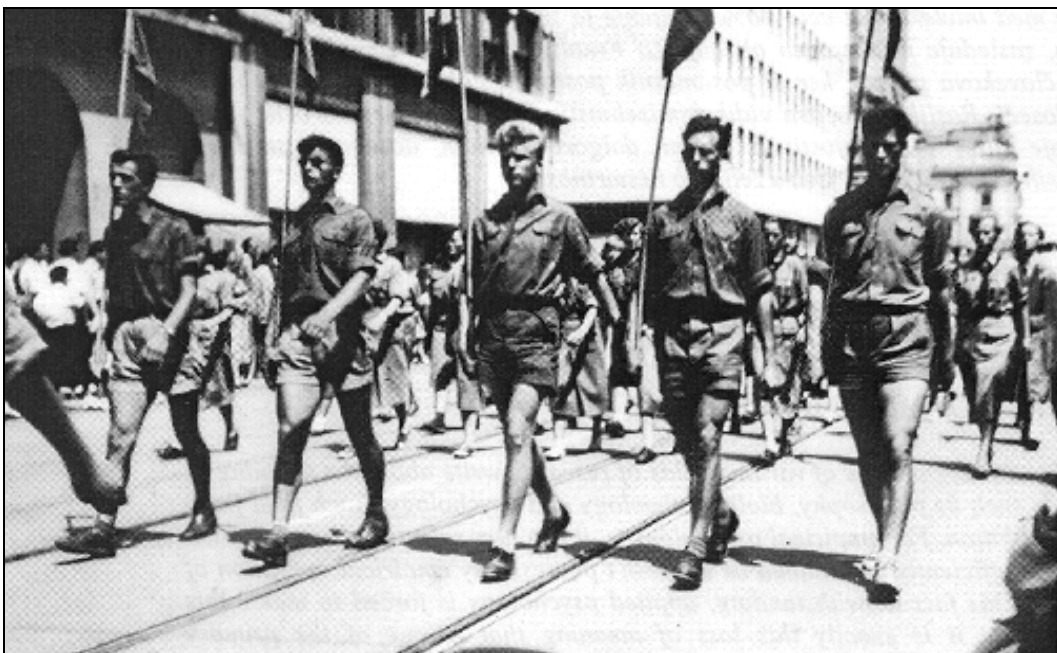
Na taborjenje v Ljubljano so odšli 29. junija 1955 in že prvi večer nastopili ob tabornem ognju, kjer so z odlično odpetim programom prijetno presenetili zbrano občinstvo. Organizatorji taborniškega zleta so 3. julija 1955, dan pred odhodom, pripravili veliko parado po ljubljanskih ulicah.