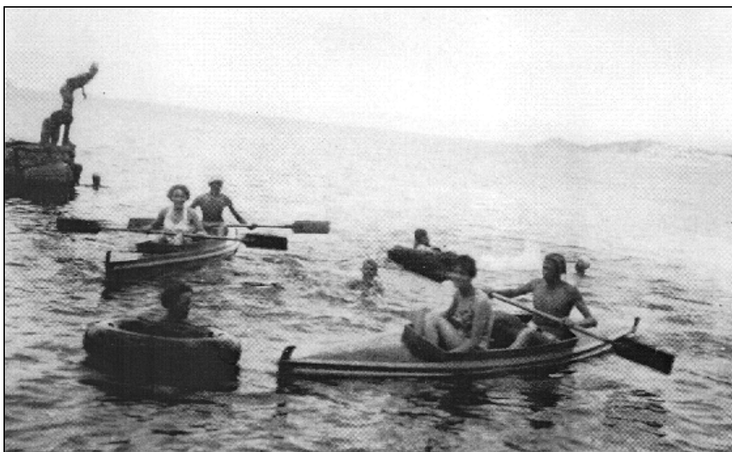
Ajdovski taborniki so si s pomočjo mizarjev v mizarški delavnici gradbenega podjetja Primorje leta 1954 izdelali dve sandolini, ki so ju še isto leto pripeljali na Krk. Z njima so veslali po morju in poskušali ujeti kakšno ribo. Včasih so ju povezali v katamaran in z njim jadrali ob obali. Uporabljali so ju tudi kot rešilna čolna, če se je kateri od neveščih plavalcev preveč oddaljil od obale. Veliko veselje je trajalo do 8. julija 1955, ko je neurje eno sandolino povsem uničilo in drugo poškodovalo.

Zadovoljno poslušalstvo je bilo še en razlog, da so se mladi pevci le s težkim srcem poslovili od kraja in kolektiva. Vsi so imeli le eno veselo upanje, da se drugo leto spet snidejo. 34