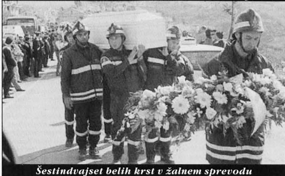
Šestindvajset belih krst v žalnem sprevodu