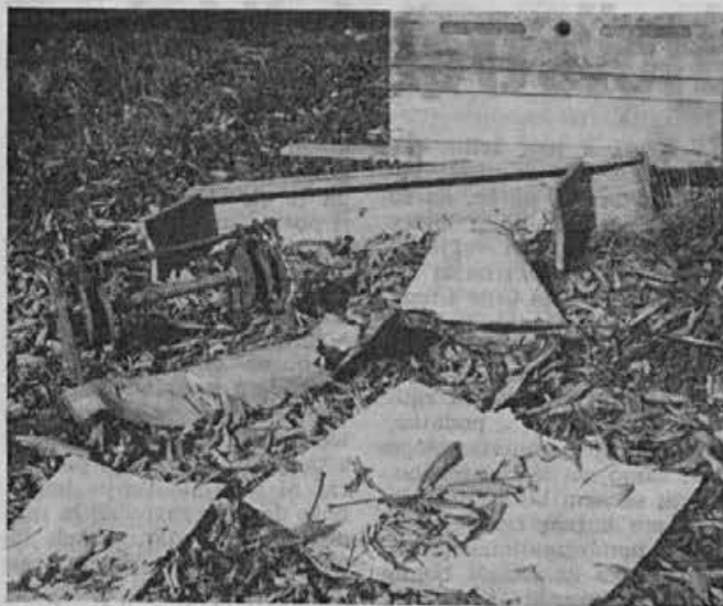
Taki prizori nam prav gotovo niso v ponos