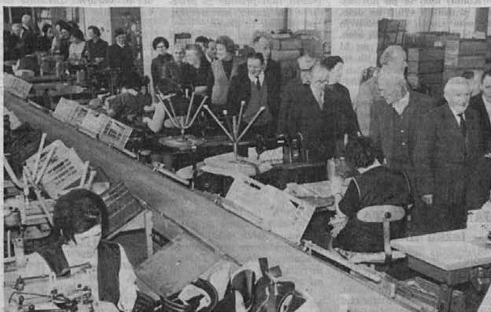
Nekdanji člani našega kolektiva si še vedno radi ogledajo kaj je novega v proizvodnji

oPsebno se počutimo počaščeni, ko se že vrsto let kolektiv spomni nas upokojujencev in nas povabi ob koncu leta na slavnostni sprejem in nas pogosti. Za nas upokojujence je to prav poseben praznik, saj se tu dobimo kot stari delavci, da se med seboj pogovorimo in obudimo naše spomine na naša težka pretekla leta. Žal nam je, da se vrste naših starih delavcev redčijo. No, naj sedaj še v imenu vseh upokojujencev in članov našega društva želim vodstvu in vsemu kolektivu tovarne Alpina mnogo sreče in zdravja ter poslovnih uspehov v novem letu 1974.