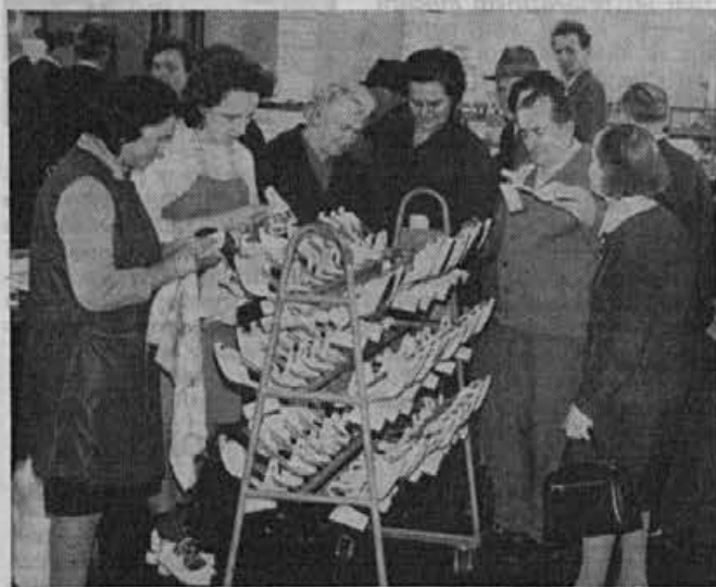
»So to že modeli za pomlad« so se zanimali