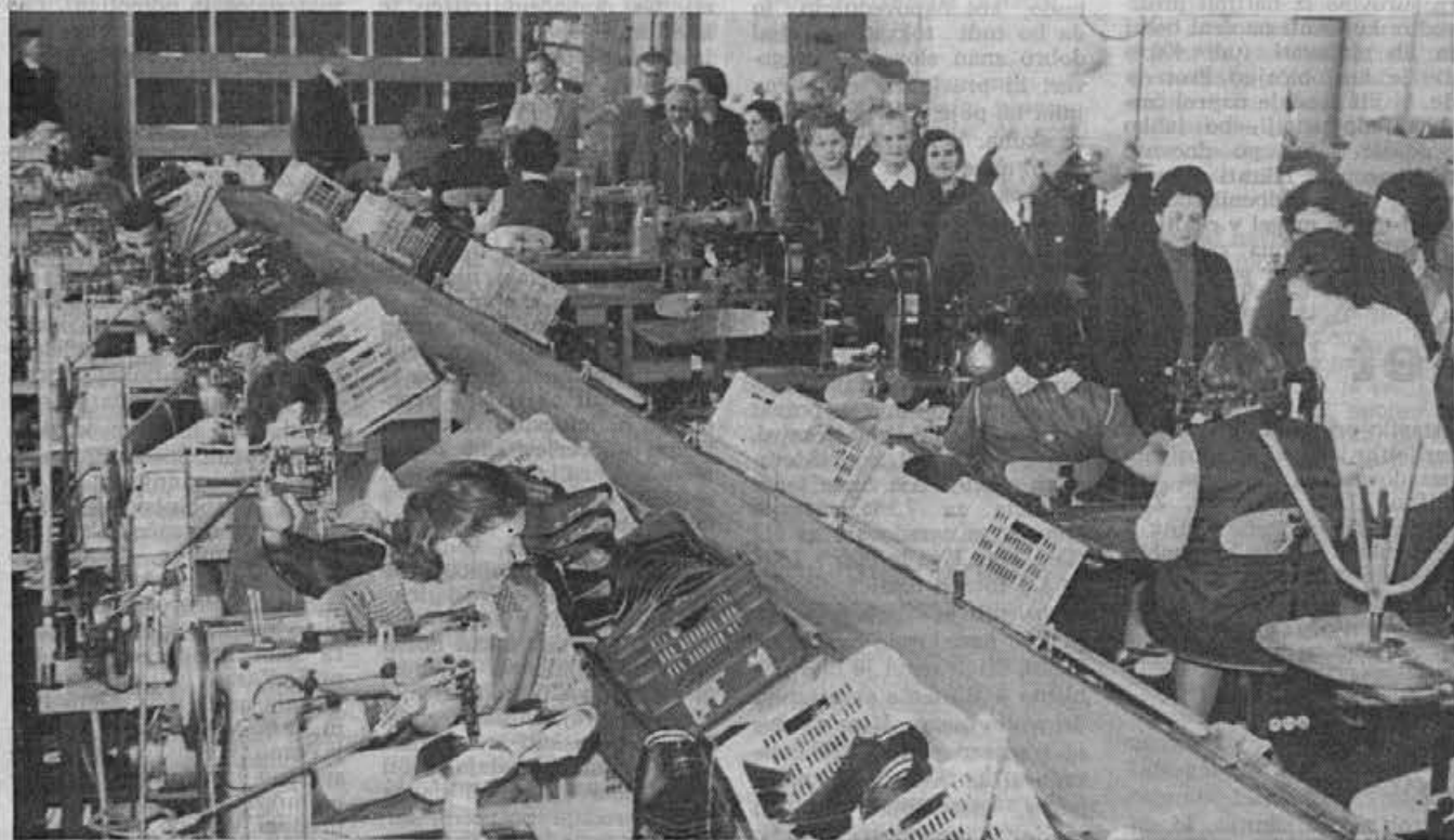
Nekdanji člani našega kolektiva — naši upokojeenci — so bili povabljeni na novoletni sprejem. TALE POSNETEK JIH KAŽE MED OGLEDOM PROIZVODNJE