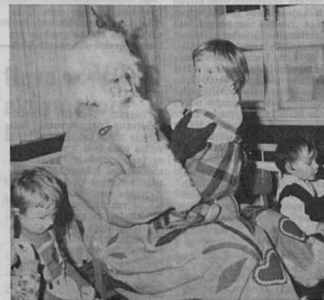
Obiskal je tudi otroke v vrtcu — malčki se ga niso prav nič bali

Kruhova pijanost je najhujša (Slovenski pregovor)