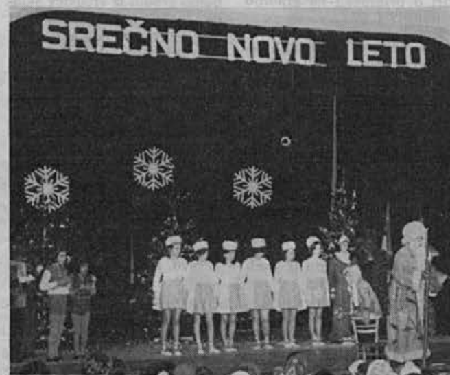
Dedek MRAZ je vsem zaželel veliko sreče v novem letu