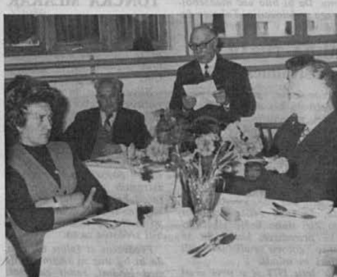
Predsednik upokojujencev se je zahvalil za sprejem

27. decembra 1973 je bil prirejen sprejem za upokojene delavce našega podjetja. Vabljenih je bilo 182 upokojujencev, odzvalo se jih je okrog 140. Do sedaj je bilo v podjetju upokojujenih 266 delavcev.