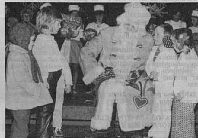
Predno je cicibanom izročil darila je z njimi še malo pokramljal