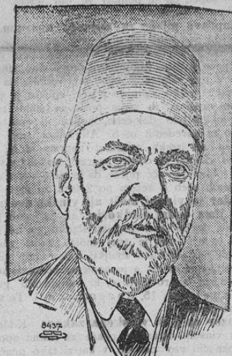
Ismael Kemal Bey

Poročali smo, da so v Valoni in drugih mestih albanski voditelji proglasili samostojnost Albanije in s tem vstvarili na Balkanu novo državo. Postavili so se takoj pod varstvo Avstro-ogrške in Italije. Izvolili so provi-