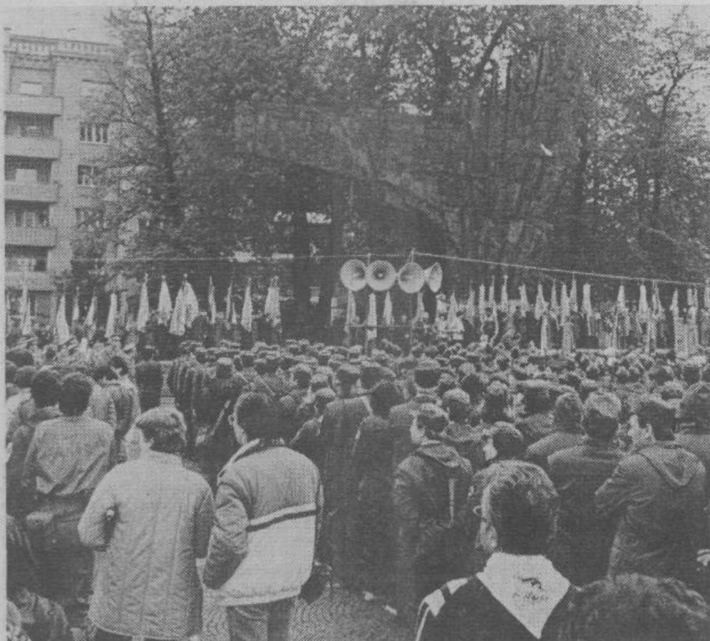
Osrednja slovesnost 28. pohoda po poteh partizanske Ljubljane na Trgu revolucije