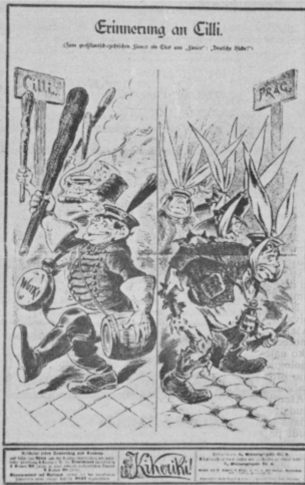
Karikatura iz nemškega humorističnega lista Kikeriki (15. 8. 1899) – Epilog češkega obiska v Celju 1899.

Podobno kot drugod po Štajerskem je tudi v Celju in okolici veljalo pravilo, da veselica brez pretepa ni prava veselica. Po kulturnem in zabavnem programu ter sproščnemu rajanju je vzdušje na veselicah postajalo iz ure v uro bolj naelektreno, dokler ni kulminiralo v vseplošnem pretepu, kot ga dandanes vidimo le še v kakšnem ameriškem westernu. Povodi za pretepe so bili običajno neznatni (namerno razbijanje kozarcev ali stare zamere), vzroki pa vedno in povsod isti: prekomerno nalivanje z alkoholom in stopnjevana agresivnost obiskovalcev. Zaradi tega se je del celjskih meščanov, ki jim zabave po načelu: »Auf biks! Kri v luft, čreve na plot!« niso bile po godu, le redko in s strahom udeleževal teh »prostaških« veseljačenj. Seveda ne zaradi pomanjkanja korajžje, saj so bili tudi pretepi po mestnih gostilnah nekaj povsem običajnega, ampak predvsem zaradi tega, ker se je meščan hotel držati ustaljenih vedenjskih obrazcev tudi pri suvanju in rukanju.