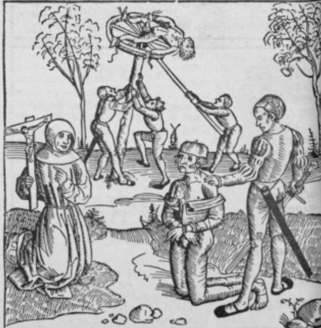
Ilustracija: (Valentinitsch »Hexen und Zauberer 113)

Podoba justifikacije iz leta 1507. Obsojenec spredaj v prisotnosti meniha čaka, da mu bo krvnik odsekal glavo. V ozadju je drugačen primer usmrtitve. Žrtev po na kolesu izpostavljena smrti od lakote in žeje ter krepiljem in kljunom ptic ujed. Taka smrt je bila namenjena predvsem čarovnikom, coprnicem, ki so bili namenovani predvsem na grmadi.