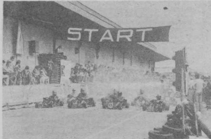
Start tekmovalcev razreda C/125 ccm — seniorji