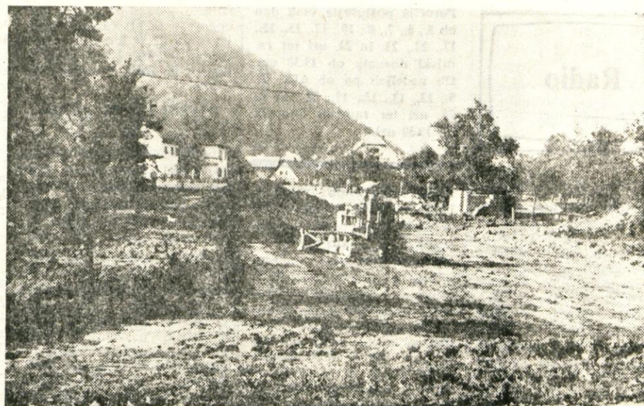
V teh dneh urejajo v Stražišču pri Kranju Delavsko cesto; uredili bodo odsek od potrošniškega centra do Škofjeloške ceste. Na tem odseku so zaradi razširitve morali podreti tudi skedenj. Cesto preureja Cestno podjetje Kranj

odrasle kopalce. Nenadoma je potonila. Eden izmed kopalcev, ki je tudi sam slab plavalec, je to opazil in takoj obvestil ostale kopalce, kaj se je zgodilo. Učenka je začelo iskati pet kopalcev. Po več poskusih so jo naposled našli v globini 3 m. Eden izmed kopalcev, ki je študent medicine, ji je dal umetno dihanje in ji masiral srce vse do prihoda rešilnega avtomobila. Kljub vsem poskusom učenki niso mogli rešiti življenja. — sz