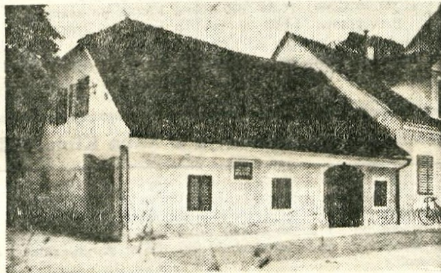
Rojstna hiša pesnika Antona Medveda v Kamniku, na Grabnu

In tudi to so dekleta zvedela, morda tudi opazila: da je brhki kaplan tudi vedno češče zahajal v žirovniško kavarnico »Pri Grosu«. (Kakšne so bile take podeželske kavarne v onih letih, si danes le težko predstavljamo — ali so bile res le kavarne ali pa morda nekašne »kafane«