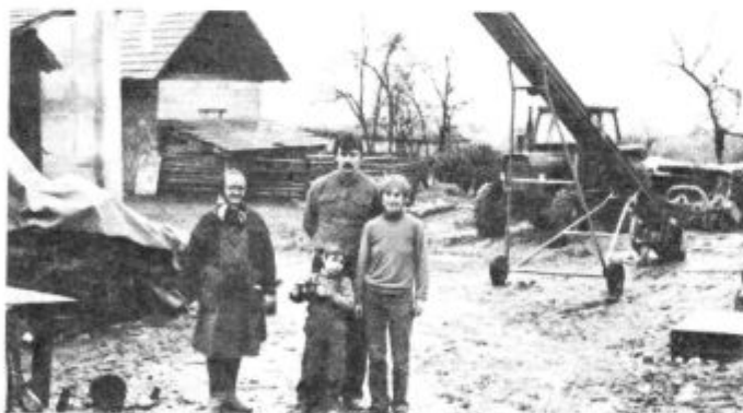
Jerebičevi iz obmejnega Lokavca nasmejano zrejo v prihodnost. Morda bo končno lepše...