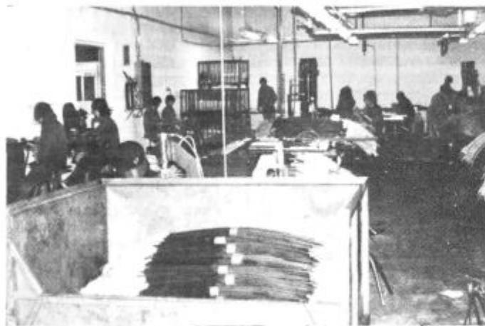
Izdelovanje bowden — poteg v Tozd Klemos-Küster.

»Temeljna organizacija združenega dela Klemos-Küster je bila formirana v letu 1972 in sicer na podlagi sovlaganja tujega kapitala. Osnovna dejavnost je proizvodnja bowden potegov za daljinsko upravljanje za avtomobilsko, motorno in kolesarsko industrijo ter kmetijsko mehanizacijo. Že ob nastanku, oz. formiranju Temeljne organizacije združenega dela, je bila ena od osnovnih usmeritev izvoz, ki se je vsa leta povečevala in v letu 1987 dosegel 40 % celotne proizvodnje. Največ izdelkov izvažamo v ZR Nemčijo v firmo Volkswa-