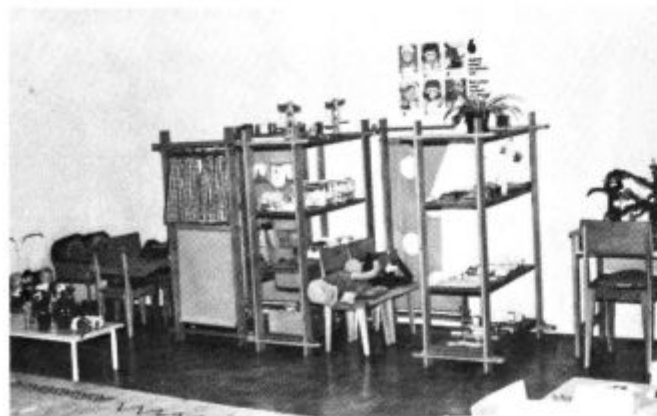
Sodobno opremljena vrtca v Gradišču so najbolj veseli malčki in njihovi starši.

Komunalno opremljanje stavbnih zemljišč v stanovanjskih in drugih območjih, se izvaja prek sklada stavbnih zemljišč občine Lenart z velikimi težavami. Z zaključitvijo komunalnega urejanja cone in oddaje parcel za individualno gradnjo ob Partizanski cesti v Lenartu smo v občini praktično izkoristili vsa razpoložljiva stavbna zemljišča. Tako je bilo potrebno v letošnjem letu pristopiti k izdelavi številnih zazidalnih načrtov (v vseh centrih KS, razen v Gradišču, kjer je zazidalni načrt letos že bil sprejet in v Lokavcu, kjer ni predviden) in k pridobivanju zemljišč.