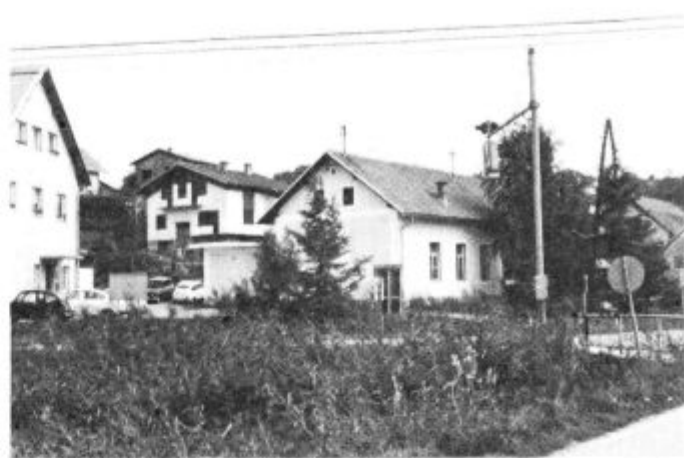
Kulturni dom v Benediktu — središče kulturnega dogajanja v KS.

Naše društvo nima kronike, kjer bi bil zapisan datum ustanovitve. Po svej verjetnosti pa ob-