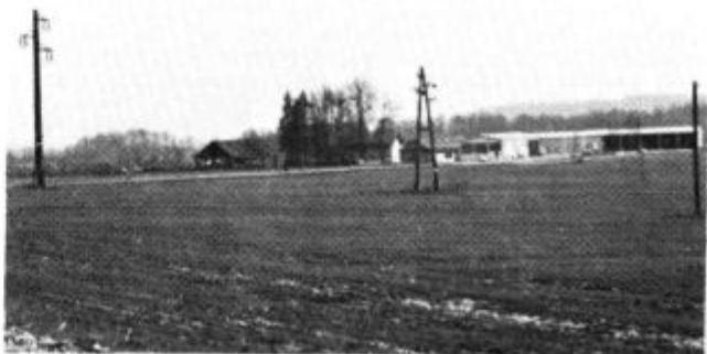
Jesensko-zimska kmetijska panorama. Polja počivajo — stroje pospravljajo. Pri zasebnikih pa bodo imeli še kolone — zakaj bi torej pozabljali na tradicijo, ki se nadaljuje iz roda v rod. M. T.