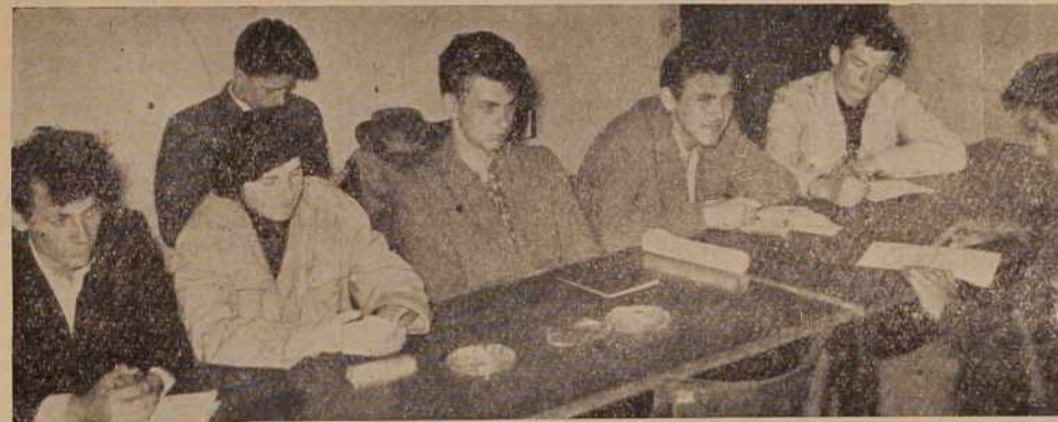
S posvetovanju predstavnikov vajenskih šol in klubov mladih proizvajalcev Pomurja v Murski Soboti, na katerem so razpravljali o stanju, nalogah in problemih vajenske mladine. Poročila s tega posvetovanja posebej ne objavljam, ker se njihove naloge in problemi dovolj jasno zrcalijo v anketi