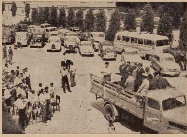
Šoferji se ob svojem prazniku vedno radi zberejo. Na sliki: praznovanje v Murški Soboti

V okviru 40-letnice KPJ in v spomin na dogodek, ko so motorizirane enote NOV prvič sodelovale pri napadu na Zu-