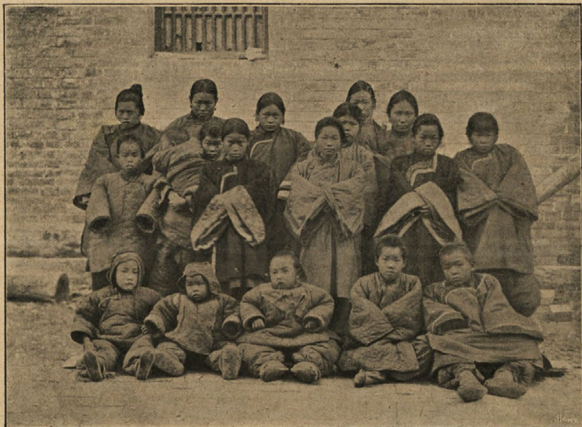
• Krščanska dekleška šola na Kitajskem.

ali celó grešna. Ta ali o' a knjiga, igra, ali veselica, ples ali tovaršija ti utegne biti v polujšanje, — ogibaj se jih! Pravo veselje najdeš le pri blagih ljudeh, pri njih je nedolžna šala, pošteno petje, neškodljiva igra. »Povej mi, koga imaš za tovariša, in povem ti, koliko si vreden.« je pisal nek moder mož. Tedaj nikdar se ne pridruži razuzdancem, nesramnikom, pijancem, preklinjavcem, nevernikom ali surovežem; išči, pošteno omikano družbo. Kako bi se mogel vesten kristijan veseliti tam, kjer se Bog žali? — Nikdar zavolj zabave v nedeljah in praznikih ne zanemari službe božje.