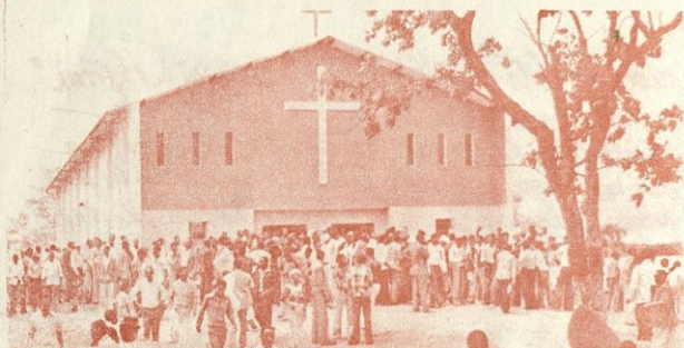
CERKEV SV. JOŽEFA