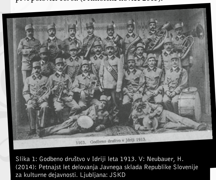
Slika 1: Godbeno društvo v Idriji leta 1913. V: Neubauer, H. (2014): Petnajst let delovanja Javnega sklada Republike Slovenije za kulturne dejavnosti. Ljubljana: JSKD

knjigi Slava vojvodine Kranjske (1877). Leta 1686 so pripravili slovesnost ob osvojitvi madžarskega Budima. Procesijo od cerkve sv. Barbare so vodili mušketirji, sledila jim je bratovščina sv. Barbare, rudarji in za njimi zastava, ki jo je spremljala godba (Neubauer 2014, 9–10). Kronist Godbe rudarjev Idrije Franc Vončina v Kroniki godbe na pihala rudarjev iz Idrije leta 1965 postavlja začetek delovanja godbe v leto 1665. Sklicuje se na ugotovitve zgodovinarja in muzealca Janka Trošta, čeprav se ne ve zagotovo, kako je Trošt določil začetek delovanja v leto 1665 (Hvala in Viler 2015, 18). Rudnik je v Idriji deloval že konec 15. stoletja. Rudarji so se morali po napornem delu razvedriti z glasbo, zato je možno, da je godba obstajala že v prvi polovici 16. st. (Primorske novice 2015).