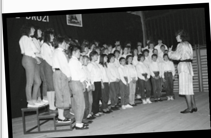
Slika 4: Mladinski pevski zbor na prireditvi Doni pesem, brate druž! leta 1989. V: Mestna zveza kulturnih organizacij Maribor (1989): Foto arhiv mestne zveze kulturnih organizacij Maribor (foto: Marjan Laznik)

institucijah niso našle možnosti. To so zlasti sodobni ples ter lutkovno in gledališko eksperimentiranje (Enciklopedija Slovenije 2001, 258).