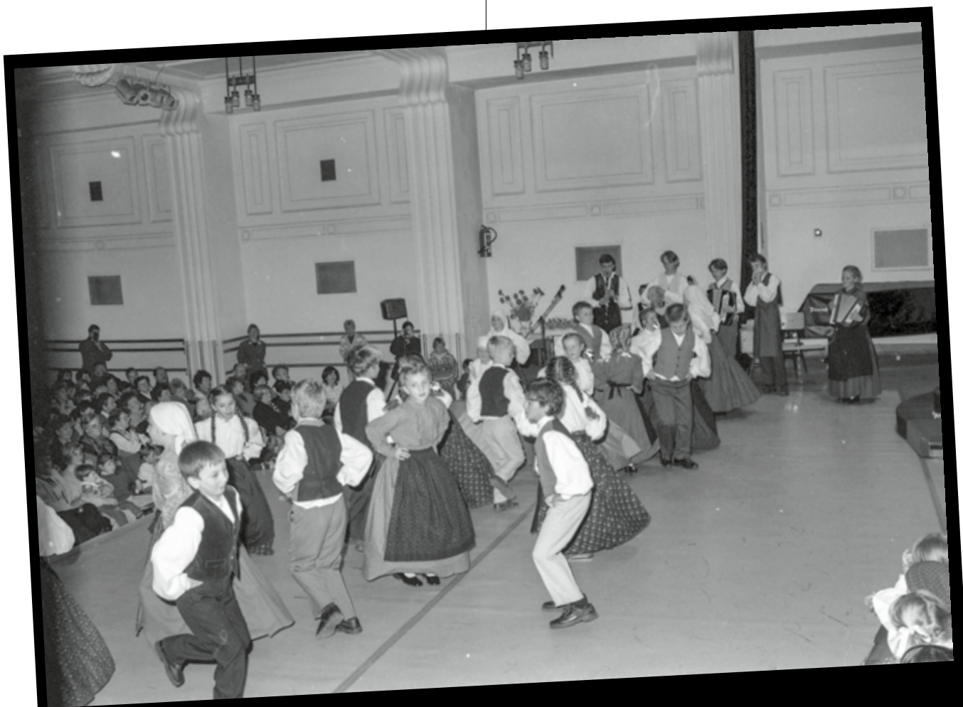
Slika 5: Nastop otroške folklorne skupine na srečanju v Unionski dvorani Maribor leta 1997.

posredno vplival na različne javne službe, zavode, podjetja, tudi na organiziranost ljubiteljske kulture.