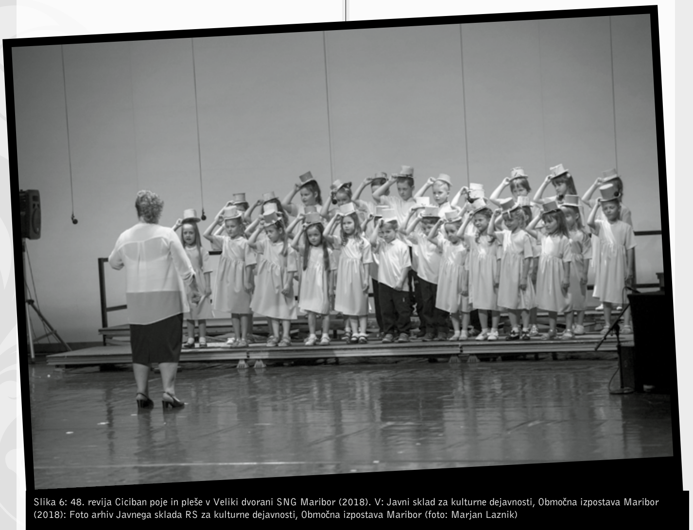
Slika 6: 48. revija Ciciban poje in pleše v Veliki dvorani SNG Maribor (2018).

Z novo društveno zakonodajo leta 1974 se ustanavljanje društev poenostavi in omogoča ustanavljanje od spodaj nav-