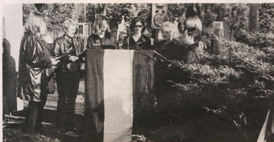
Zbor »Pet in tri« je prispeval ubran glasbeni okvir