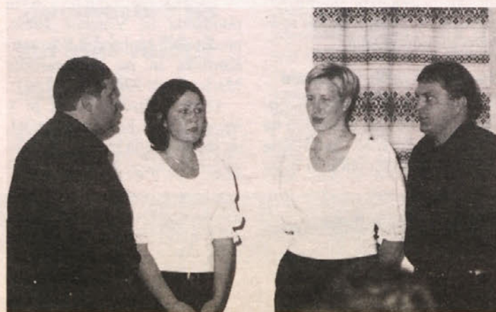
Kvartet TREM z Obirskega

Minulo nedeljo, 27. oktobra 2002 popoldne, je SPD »Herman Velik« s Sel-Kota pri Lenčiji na Bajtišah priredilo pevski koncert. Pevska prireditev krajevnega značaja je navsezadnje prerasla v pravi »svetovni« koncert, saj so nepričakovano nastopili pevci iz Zambije in tako speli lok do osrčja Afrike.