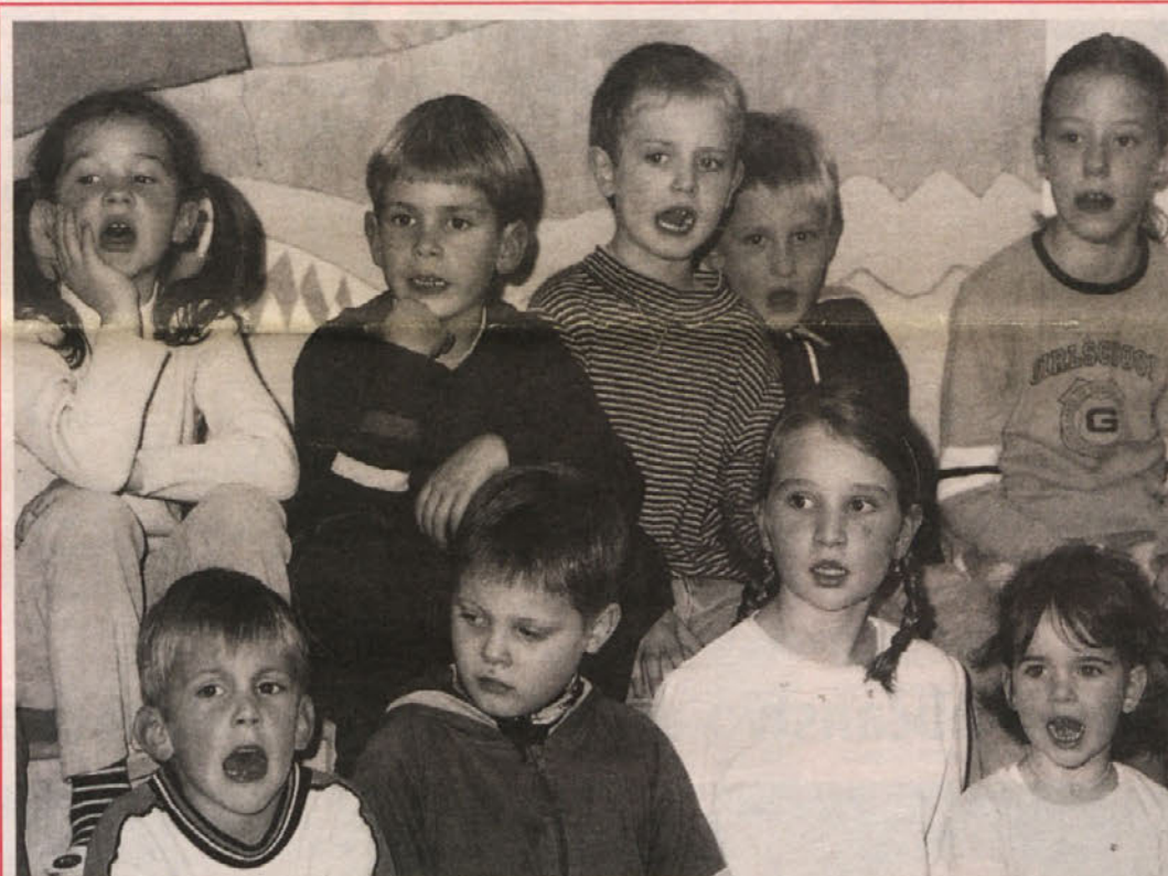
Lepi, novi prostori za otroški vrtec v Borovljah, žareči obrazi družtenikov, posebno pa staršev, otrok in seveda vzgojiteljic ... Preberite uvodni članek in nadaljevanje na strani 7.

ZVEZA KOROŠKIH PARTIZANOV IN PRIJATELJEV PROTIFAŠISTIČNEGA ODORA