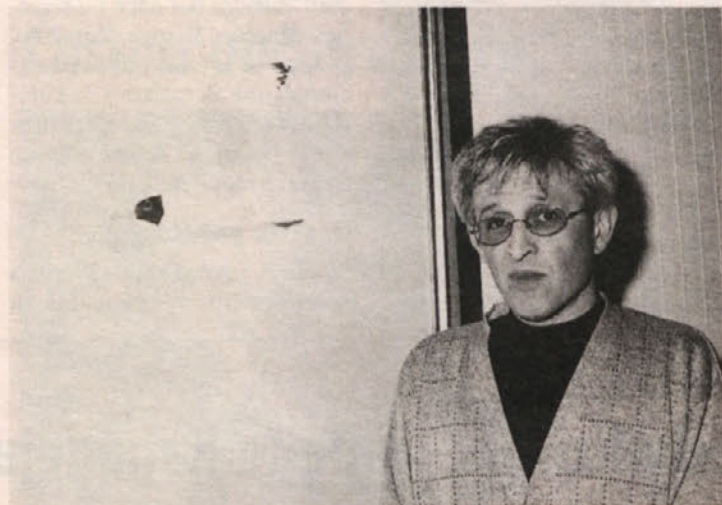
Blaton-Blatnik z galebom nad sinjim morjem

Že samo slikanje nekega ptiča je zelo zahtevna in časovno zamudna zadeva. Z emajliranjem pa je postopek še daljši, ker je treba sliko dobesedno vžgati na glinasto podlago.