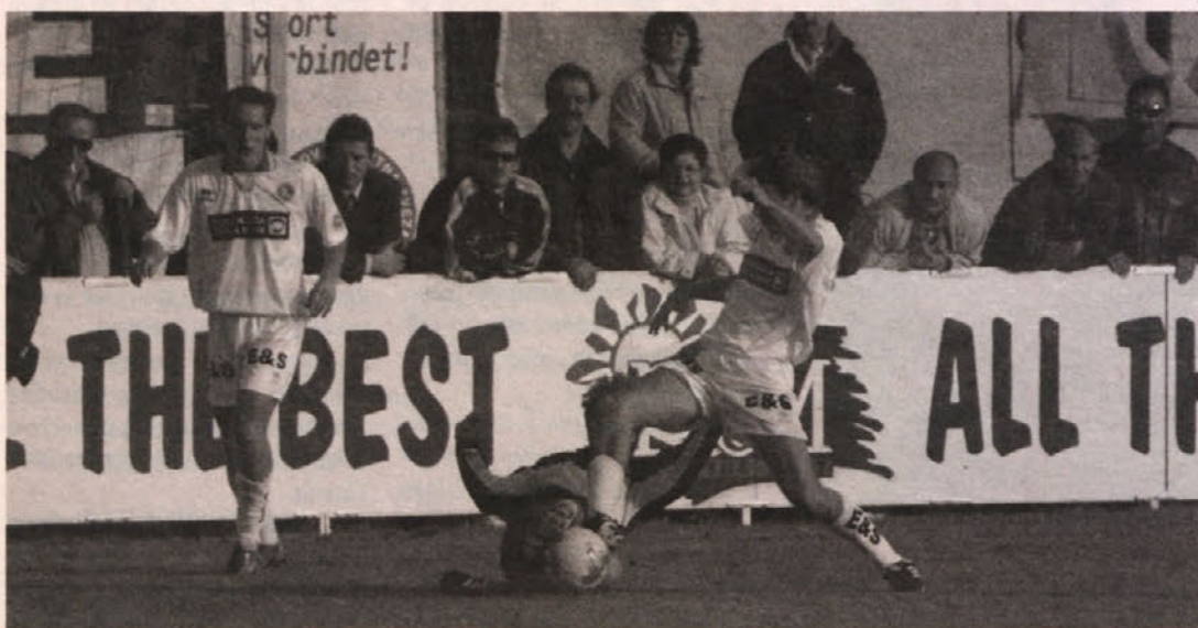
S stoodstotno pripravljenostjo se hoče SAK (beli dres) posloviti z zmago od svojih navijačev