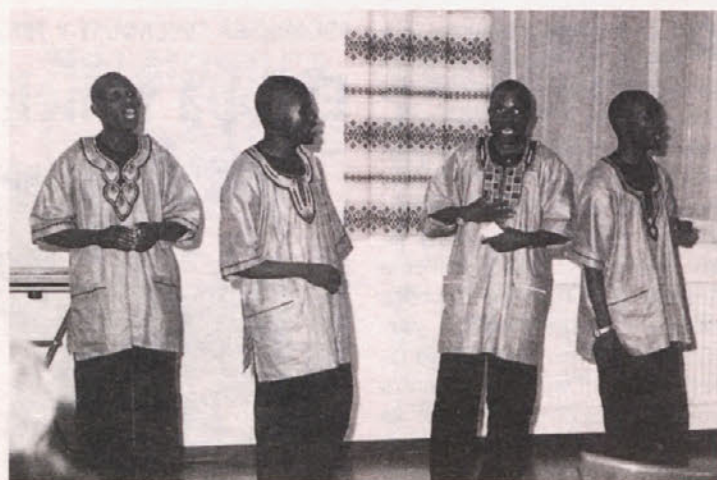
Habakuk-Brothers so prinesli pozdrave Afrike

Filmi: »Mladinski dom – skupna hiša«, »Velika ljubezen«, »Večno prijateljstvo« in »Edina prijateljica« Mentor krožka: Ciril Murnik; sponzor: Slovenska prosvetna zveza