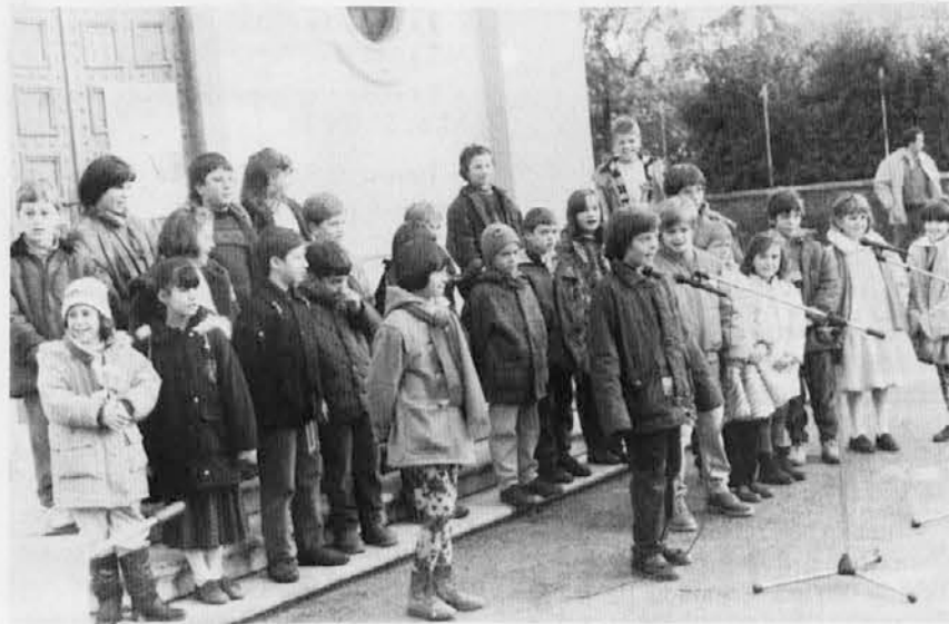
Posnetek iz lepega božičnega srečanja na glavnem štandreškem trgu pred cerkvijo v nedeljo, 22. decembra, na katerem je sodelovala vsa vaška skupnost. Osrednji del programa je oblikovala štandreška osnovna šola »Fran Erjavce«, ki jo vidimo na sliki