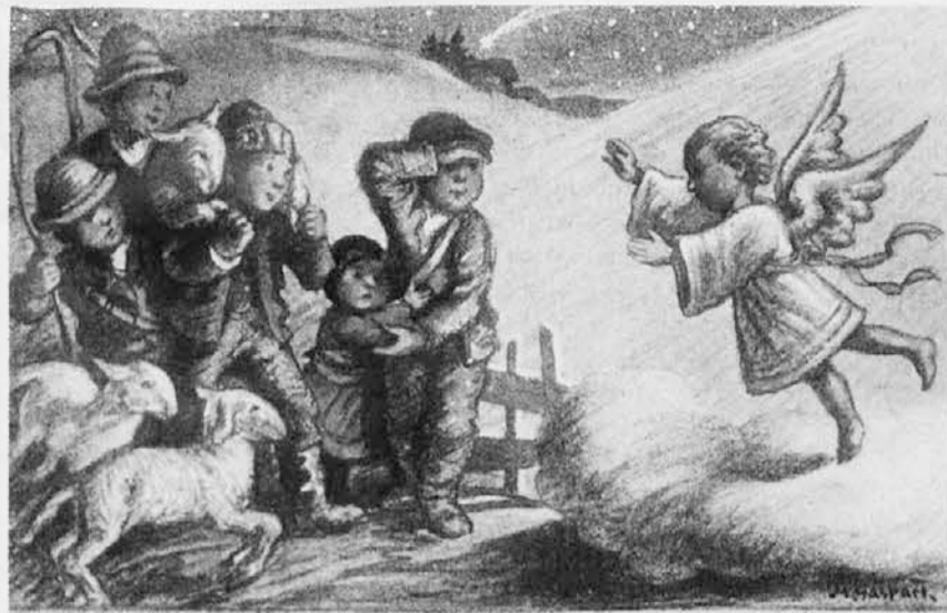
✦ KAJ SE VAM ZDI PASTIRCIKI, ALI STE KAJ SLIŠALI? ✦

Vstopili smo v novo leto. Ko je polnoči odbila ura, so za trenutek ugasnile električne žarnice in naznatile konec starega leta in začetek novega. Ta polnočna ura je edina v letu, ki jo ljudje z veliko nestrpnostjo čakajo. To bi moral biti trenutek, ko bi se moral človek zamisliti v preteklost in tudi v bodočnost, kaj bo novo leto prineslo, kaj skriva pod svojim skrivnostnim plaščem.