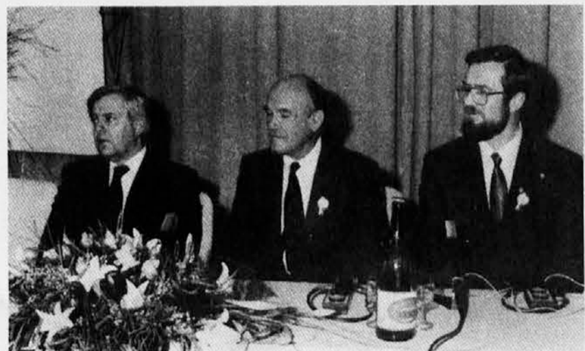
Trije glavni tvorci slovenske ustave

S sprejemom ustave se je formalno končal proces iskanja temeljne slovenske pravne podobe. Slovenija je s tem najvišjim aktom presegla skrbi za obstoj naroda in postala varuhinja pravic in svoboščin državljanov. Za vse brez razločka je postala branilka demokracije in pluralizma ter spodbujevalka gnotne in duhovne blaginje.