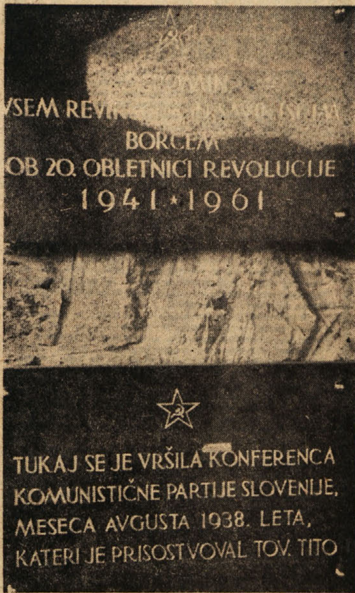
Plošči, vzdani na pročelju ob vhodu v Dom revirskih in savinjskih borcev NOV na Vrheh

V mnogih hišah na tem področju so naši ljudje nudili zavetje partizanskim borcem. Skrajka; partizan se je tu več ali manj počutil kot doma.