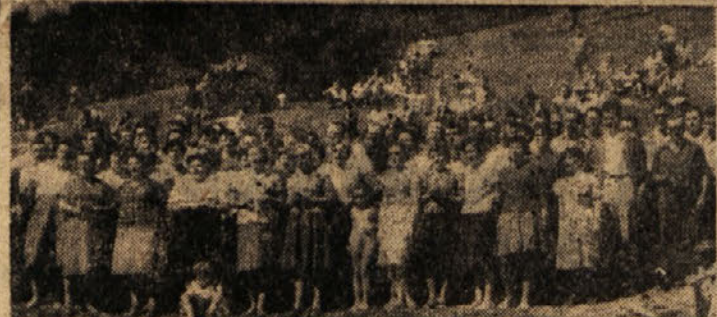
Med nastopom združenih pevskih zborov na Vrheh

Preko Vrhov so vodile znane partizanske in kurirske poti. Tu