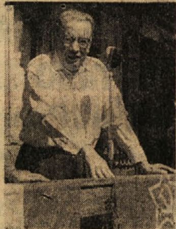
Udeležencem velikega partizanskega slavlja na Vrheh je spregovoril tudi predsednik Ljudske skupščine LRS, tovariš Miha Marinko

Že 1937. leta je bil v neposredni bližini Vrhov, na Cebinah, ustanovni kongres Komunistične partije Slovenije. Leta kasneje, meseca avgusta, je bila v bližini na-