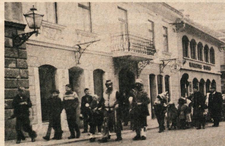
Pustna parada najmlajših