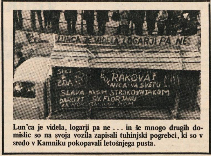
Lun'ca je videla, logarji pa ne... in še mnogo drugih domisljic so na svoja vozila zapisali tuhinjski pogrebci, ki so v sredo v Kamniku pokopavali letošnjega pusta.

Zagotoviti sredstva za asfaltiranje ceste Križ – Komenda od sredstev za vzdrževanje te ceste