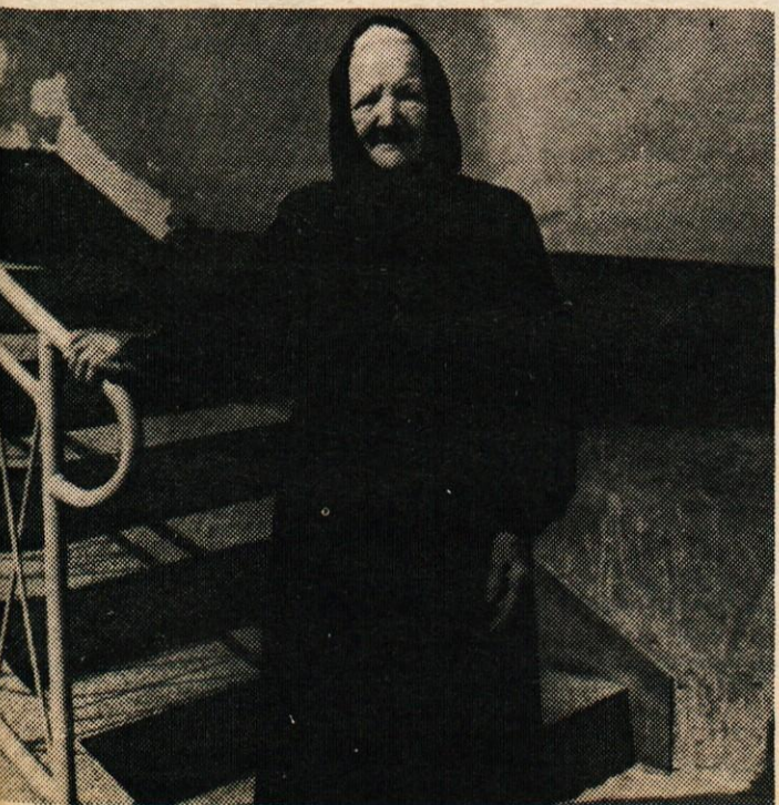
Gračarjeva mama iz Volčjega potoka

Bila je vesela, da se je ob prazniku kdo spomnil tudi nanjo ... ak