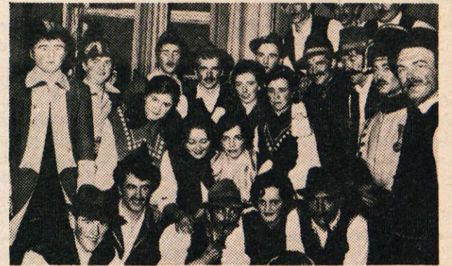
„NAŠA KRI“ v Zgornjem Tuhinju: Kulturno-prosvetno društvo iz Zgornjega Tuhinja, v katerem sodeluje tudi precej mladih, je v zimskih mesecih naštudiralo Finžgarjevo ljudsko igro Naša kri, s katero so se že predstavili domačinom na odru v Lazah. V teh dneh pa gostujejo tudi v okoliških krajih.

Uporabljam to priliko, da se vsem delavnim članom iniciativnega odbora za ustanovitev temeljne kulturne skupnosti za pomoč in njihovo prizadevnost posebno zahvaljujem.