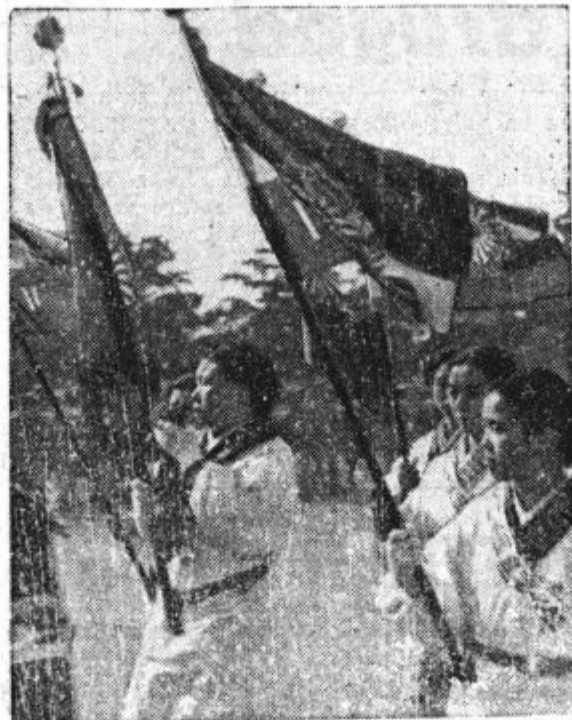
...na ulicah glavnega mesta Tokia proslavljajo 2598. obletnico ustanovitve japonskega cesarstva. Slika nam nazorno priča, kakšen duh vodi sodobno vzgojo japonske mladine. Kljub temu je seveda veliko vprašanje, če se bo Japoncem posrečilo doseči svoj imperialistični cilj. Poročila z bojišč so pač taka, da jih nikakor ne morejo prevpiti nobene poulične parade. Ljudje si dajo ukazovati, življenje si ne da nikoli.

Vlada je pripravila nov zakon o državljanstvu. V kratkem bo predložila parlamentu v odobritev načrt, ki vsebuje tudi nekaj politično važnih določb. Med drugim je pri podeljevanju državljanstva po novem zakonu treba paziti tudi na to, da prosilec kolikor toliko obvlada češki jezik. Nadalje je omembe vredna določba, da