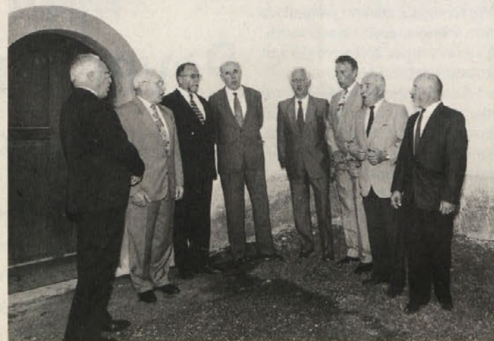
Slovenski oktet, ki je Kernjakove pesmi ponesel tudi med predsednike in kralje