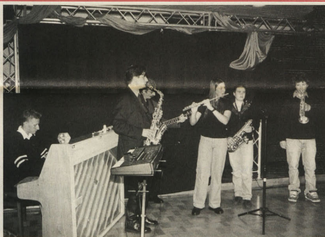
Bivši šolarji/ke Mohorjeve ljudske šole, ki svoje talente-instrumente naprej negujejo tudi v Slovenski gimnaziji, kar seveda velja tudi za lutkarje.