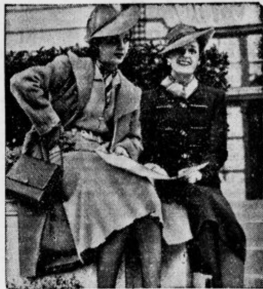
Takale pomladanska moda se je kazala letos v francoskem Auteuilu.

Rdeči so zažgali ali razstrelili mnogo poslopij, med njimi katedralo. Med razvalinami razdejanih hiš so našli mnogo zoglenelih trupel. Iz škofije pa so pokradli, preden so ušli, največje dragocenosti, ki so bili tamkaj shranjene.