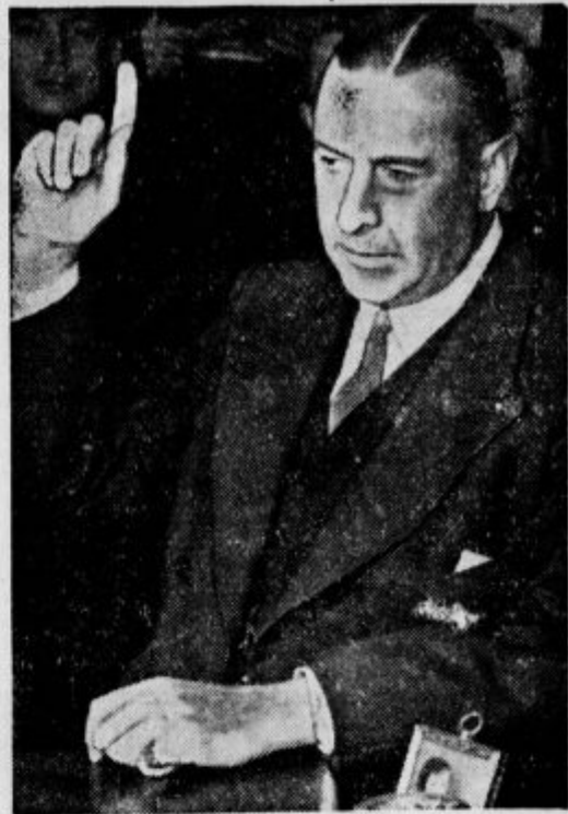
Newyorški borzizjanski kralj pred sodniki. Bivši predsednik newyorške borze in družabnik bogate Morganove banke Waitnay se mora pred sodniki zagovarjati zaradi poloma svoje banke.

Vsebinsko bo razstava takole razdeljena: socialna skrb, javna dela, prehrana, obleka, higiena, industrija, umetnost, šola, izdelovanje in poraba.