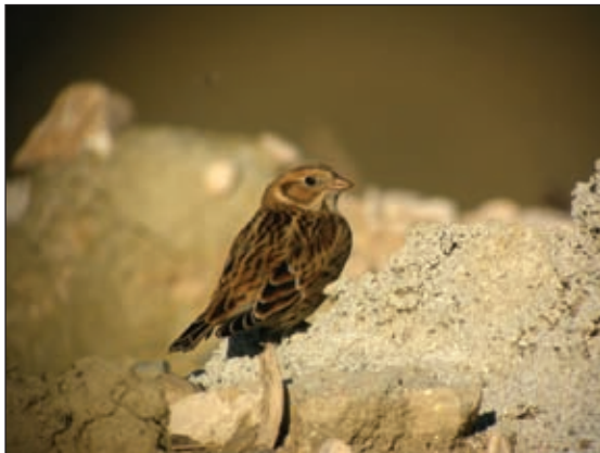
Slika 14 / Figure 14: Laponski ostroglež (♀) / Lapland Longspur (♀) Calcarius lapponicus, 12.11.2007, Sečovljanske soline.

Lapland Longspur – one female observed on 12 Nov 2007 at Sečovlje salt-pans (UTM UL93, SW Slovenia); the record was confirmed by the National Rarities Committee (6 th record for Slovenia)