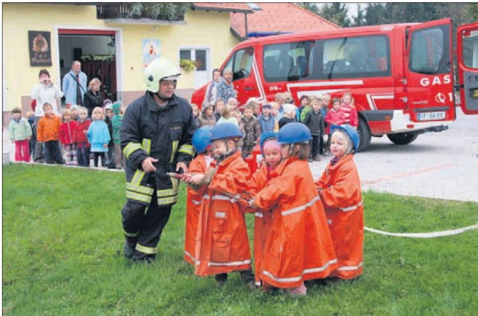
Najmlajši v akciji