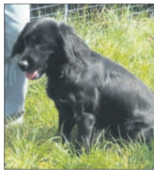
Pika, pika, pikica, to je ena slikica. Dolga ušesa, kratek vrat, pa po bradi mal' kosmat. Kdo sem? Ja, kuža, ne! (8473)

Sama sem bila v dvomih glede hranjenja s surovo hrano, a po dveh urah brskanja za dodatnimi informacijami