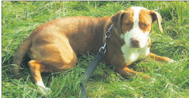
Še vedno sem žalostna in razočarana nad svojimi prejšnjimi lastniki, saj so me pustili kar na veterinarski kliniki. Ampak ko vidim druge kužke, ki odhajajo v nov dom, me to navda z upanjem, da tudi mene čaka nova priložnost. (8479)

veterinarska bolnica šentjur www.vb-sentjur.si