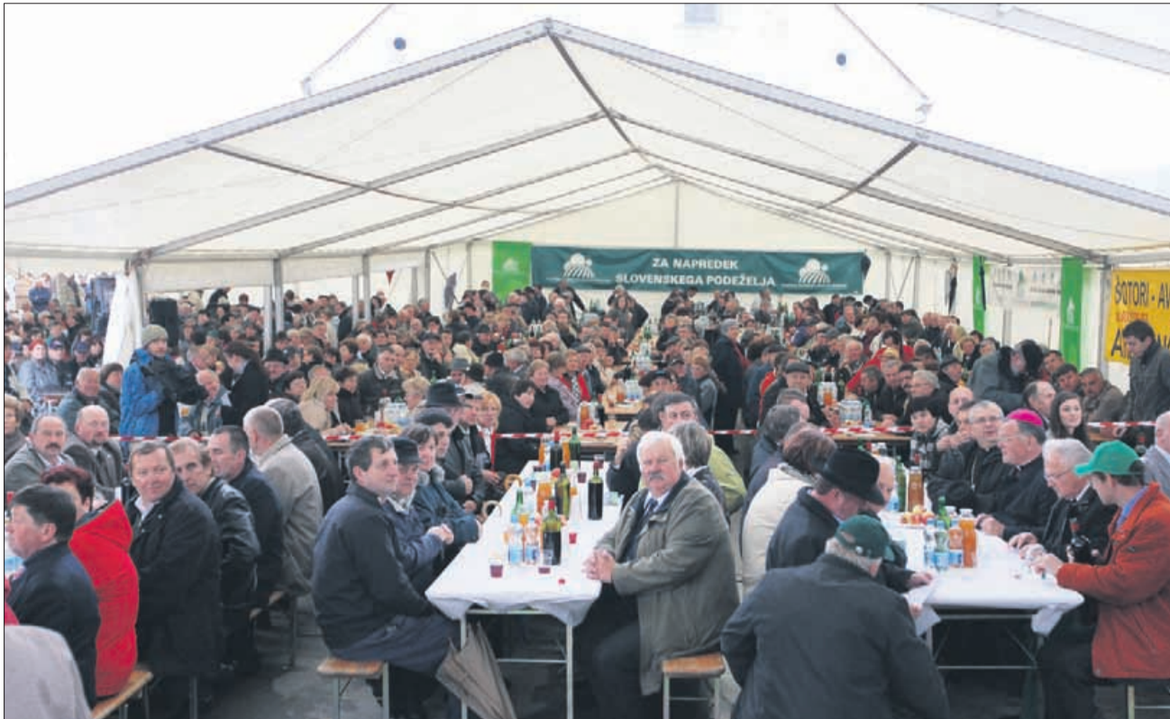
Zaradi kislega vremena niso na Slomu letos našli nič manj obiskovalcev kot običajno.