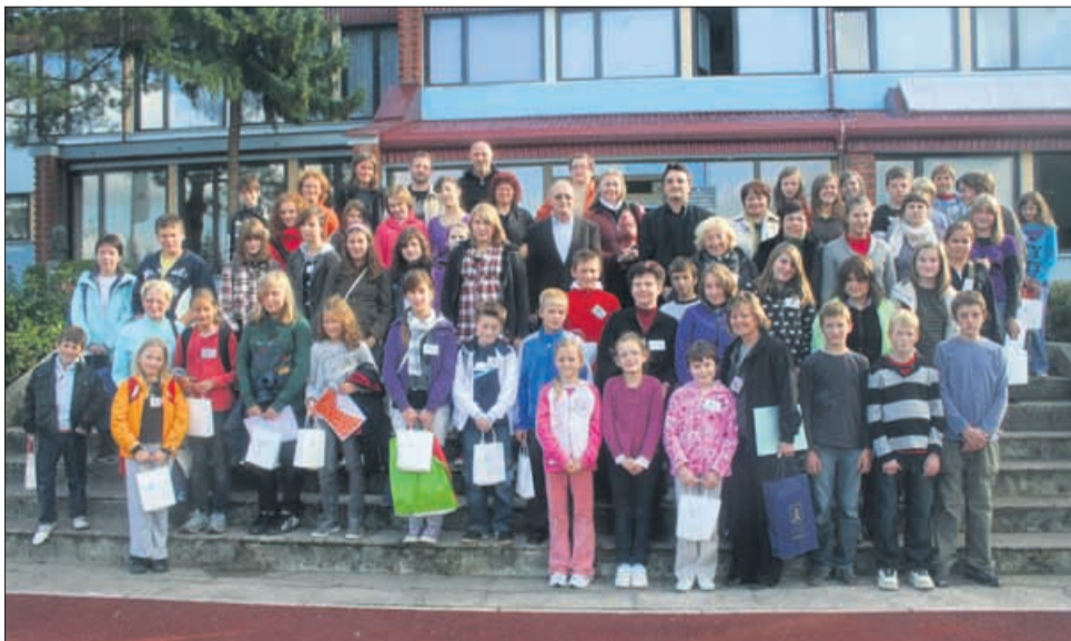
Skupinska slika z jubilejne, tridesete mednarodne likovne kolonije v Bistrici ob Sotli