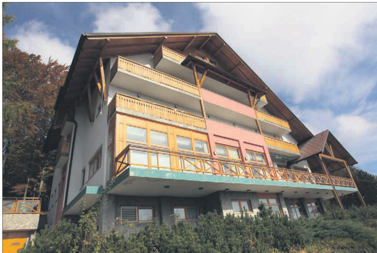
Almin dom na Svetini je zaprt že leto in pol, kupca pa še vedno ni.