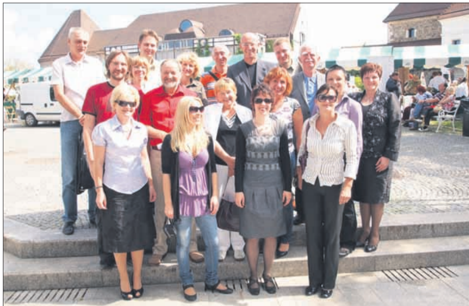
Bodoči člani društva Domači kraj na ustanovni skupščini 12. septembra na Ljubljanskem gradu

Delovanje društva je tematsko zastavljeno dokaj na široko. Društvo naj bi v prvi