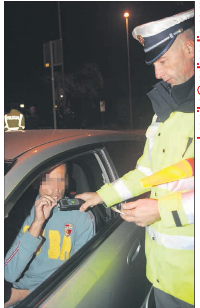
Policisti so ustavljali voznike, ki so morali opraviti preizkus alkoholiziranosti.