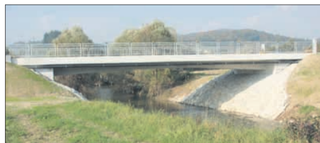
Muminovićev most na reki Paki v Paški vasi je zdaj v občinski lasti.

65 let z vami in za vas VSAK TOREK IN PETEK