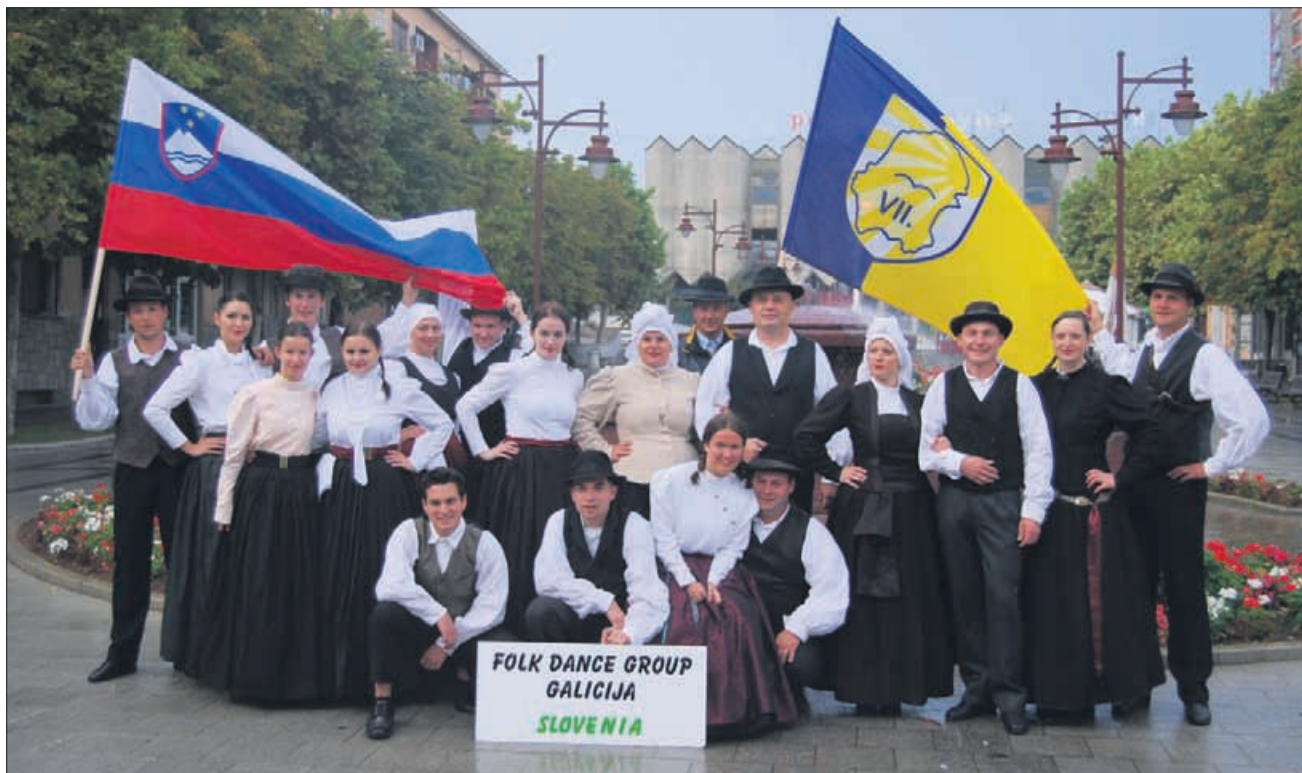
Folkloristi iz Galicije

Ravno zaradi tega smo tudi mi, s svojo nošo in našimi