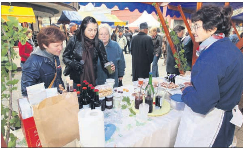
Prireditev Podeljelje v mestu je vedno dobro obiskana. Tudi tokrat ni bilo nič drugače.