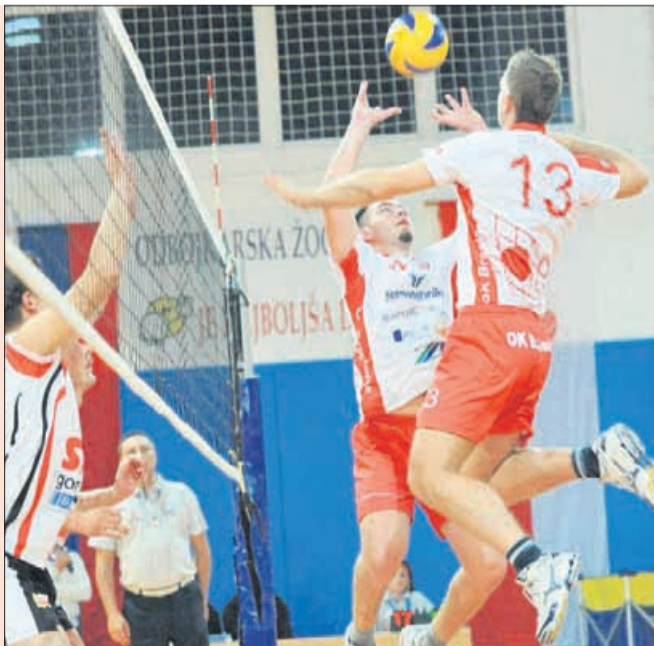
Braslovčani so imeli rdeče, Šempetrani pa črne hlačke.