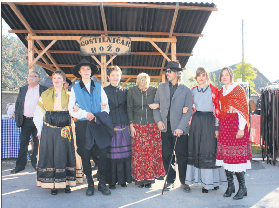
Sejemsko dogajanje so letos obogatile trške gospe in gospodič, ki jim je modna kreatorka posebej za to priložnost sešila oblačila v duhu starih časov. V svoje vrste so sprejele »slepca«, ki je za potrebe rečiškega sejma pridno prosil »ubogajme«.