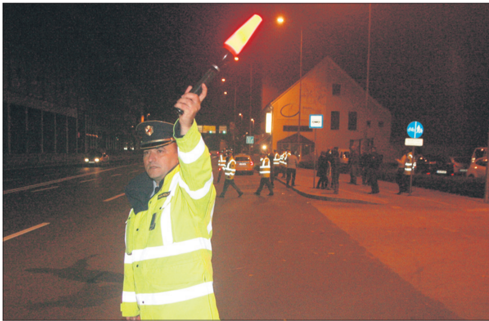
Rdeče luči so se najbolj bali vozniki, ki so ta večer pili.

prometnih nesreč. V akciji Evropska noč brez prometnih nesreč so sodelovali tudi člani Zavoda Varna pot iz Ljubljane, ki pomaga žrtvam nesreč in njihovim svojcem. Tokrat so v celjskem lokalu Branibor mlade opozarjali na