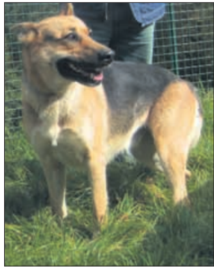
Sem 2 leti stara ovčarka, ki išče ljubimca za skupno življenje. Bodi ovčar iz Štajerske in imej dobrega lastnika. Aja, pa bodi lep, itak! (8464)

Pri slednji psa hranimo s surovimi kostmi, na katerih je še nekaj mesa, z ribami in mesom, dodatnimi maščobami in vitamini v obliki drobovine, zelenjave in ribjega olja. Verjetno ste se ob prebrnem malo zamislili, saj ste že velikokrat poslušali o povečani napadalnosti psov, ki so jedli surovo meso. Naj