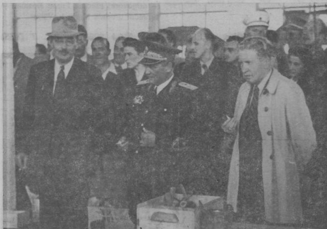
1. septembra 1947 je predsednik Tito prvič obiskal Litostroja...