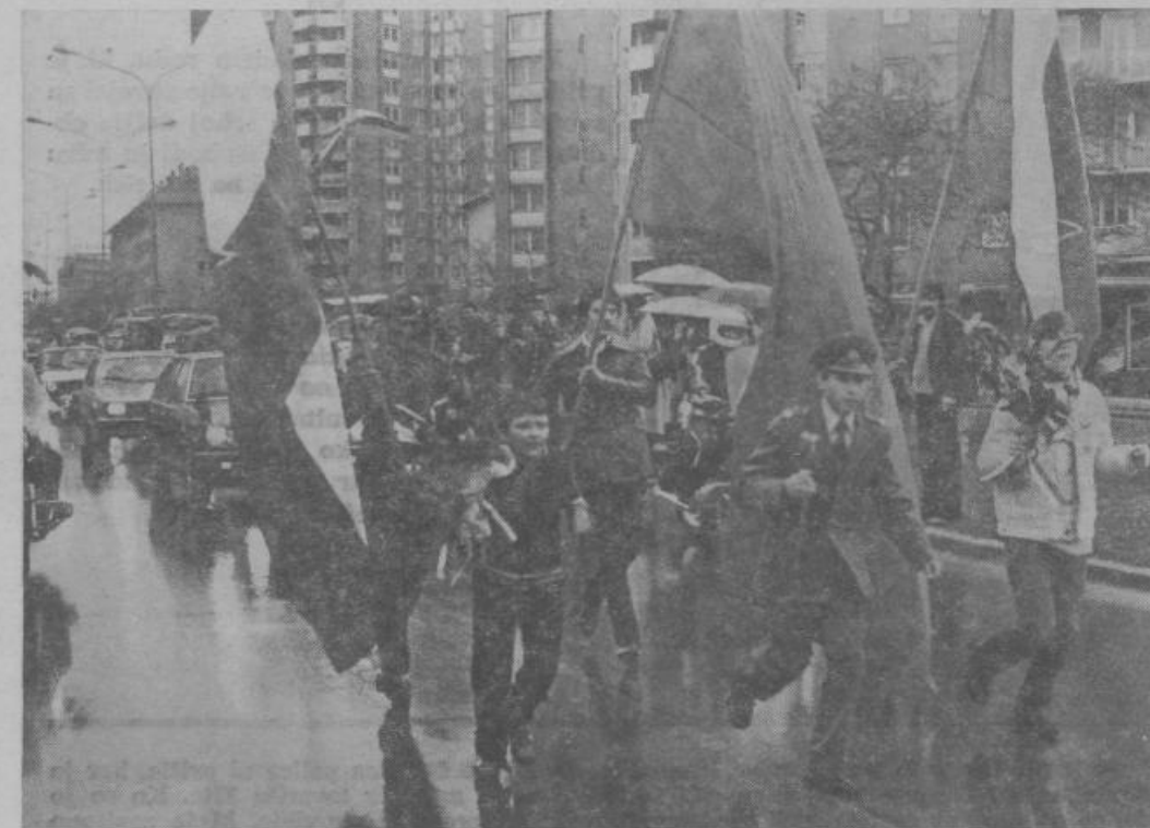
Številni pionirji, mladinci, kadeti, taborniki, vojaki, športniki smo skupaj z občani Šiške pozdravili štafeto mladosti, ki je ponesla pozdrave mladih naše občine v petek, 25. aprila 1980.