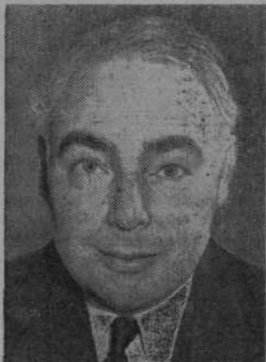
Novi angleški vojni minister Hore-Belisha.

Zaostritev položaja v sovjetski Rusiji. Lansko leto je bila sovjetska Rusija pod vtisom usmrtitve najvišjih osebnosti civilnih režimskih mogotcev. Sedaj so prišle na vrsto vojaške osebnosti. Streljanje generalov in divljanje Stalina je najbolj kričeč dokaz, da je boljše vizez na smrtni postelji. Če je res, kakor trdi Stalin in najvišje vojaško sodišče, da so bili maršal Tuhačevski in ustreljeni generali špijoni, potem je rdeča armada itak v razpadanju. Po angleških