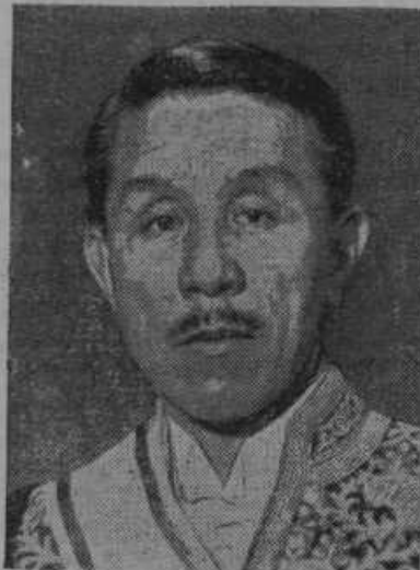
V novi japonski vladi kneza Konoze je prevzel zunanje ministrstvo Hirota, ki je že bil enkrat predsednik vlade.

Potrta Francija. Zadnji dogodki v Rusiji so zelo hud udarec za Francijo, katero veže s sovjetski pogodba. Obsodba in usmrtitev Tuhačevskega in tovarišev je napravila na Pariz najbolj neugoden vtis. Če je res, pišejo francoski časopisi, da je bil Tuhačevski špijon, ker je izdajal dostopne mu podatke, potem ne pomenja moč sovjetske vojske prav nič. To je za Francijo težek udarec, ker bi naj bila vojaška sila Rusije Francozom sigurnost pred Nemčijo. Če so znane skrivnosti rdeče armade inozemskim generalnim štabom, potem so dobili ti vpogled tudi v na-