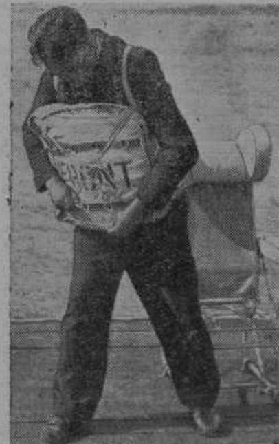
Nov rešilni pas za potnike v vodnih letalih. Rešilni pas je tudi podlaga za potniški sedež in je napolnjen z zrakom. V slučaju nesreče si ga lahko priveže potnik in se z njim obrzri na površju voda.