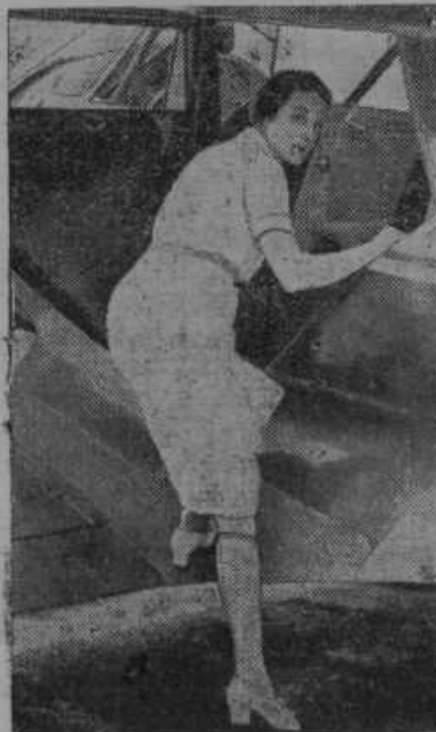
Lojza Thaden, mlada Amerikanka, je dosegla pred kratkim s svojim letalom ženski letalski rekord.