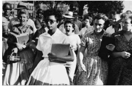
Slika 5 16

Opišejo sliko, kako so se belci obnašali do Elisabeth. Argumentirajo, ali je bil njihov protest v skladu z načeli civilnodružbenih gibanj.