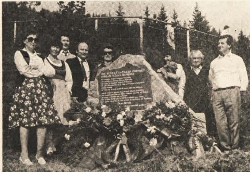
Preživeli člani in sorodniki Hojnikove družine pri spomeniku v Lepeni