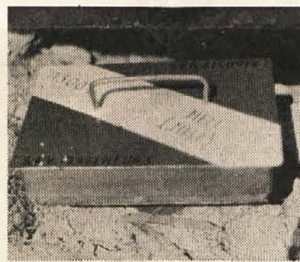
Skrinjica za vpisno knjigo