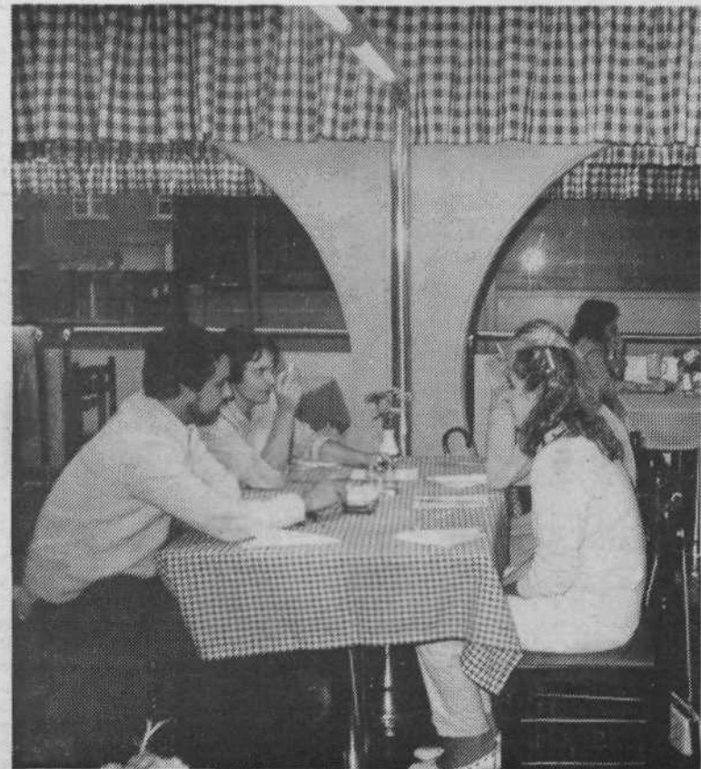
Notranjost pizzerije Janez je okusno urejena. Zato tudi pizza sama bolj tekne.