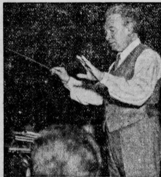
Sloveči italijanski skladatelj Ottorino Respighi, star 57 let, je umrl, ker se mu je zastupila kri.

Od sedaj naprej bo način boja proti cerkvi izbiralo skupno vodstvo, katero je bilo izvoljeno v Pragi. Po svoji osrednji zvezi bodo brezbožniki stopili v stike z vsemi »naprednimi, kulturnimi