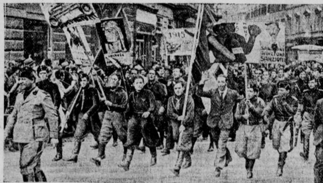
MLade italijanske rekrute letnika 1915 so te dni poklicali v vojake. Šli so v velikih aprevođih in pred seboj nosili lepake, s katerimi so kazali na vdušenje za vojaško službo. Z letnikom 1915 ima Italija sedaj pod orožjem 1¼ milijona mož.

pokretic posameznih narodov, z organizacijami duševnih delavcev, umetnikov, gledaliških igralcev, učiteljev, učenjakov in zdravnikov, da bi se v teku časa osnoval »združeni napredni kulturni pokret svobodomislecev vsega sveta.