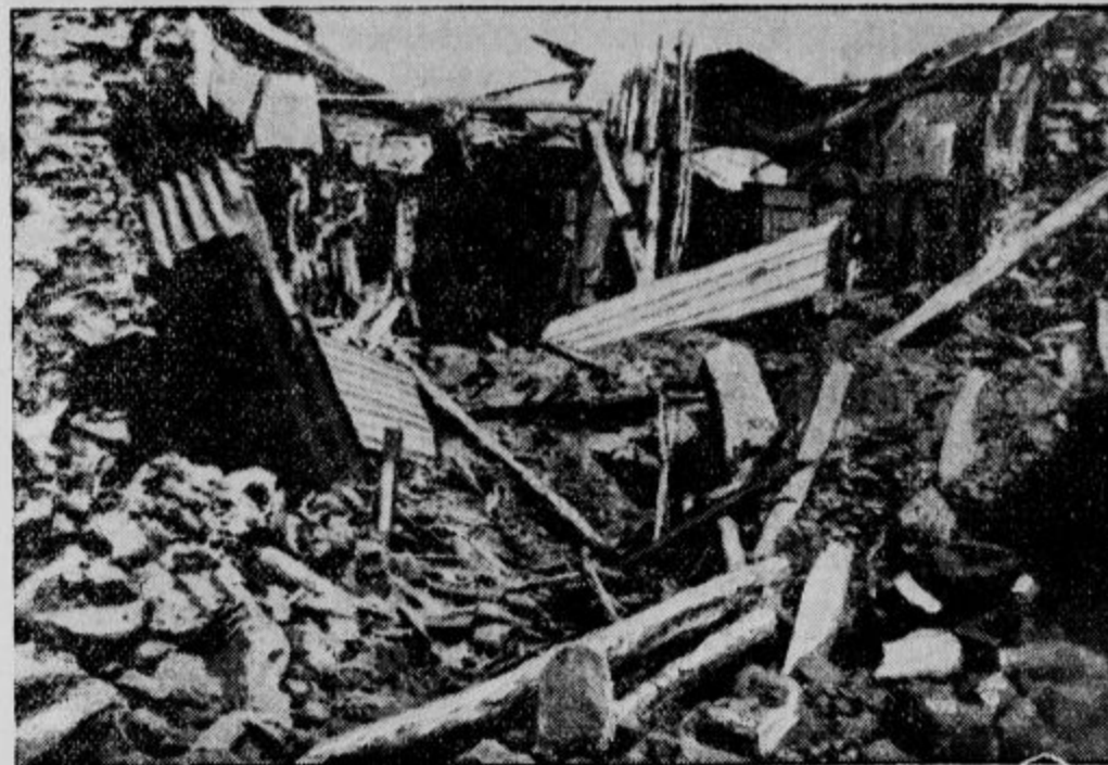
Harar, razdejan od italijanskih bomb. Tale slika je prva, ki je prišla v Evropo ter kaže, kako je italijansko letalstvo z bombami razdejal abesineko mesto Harar.