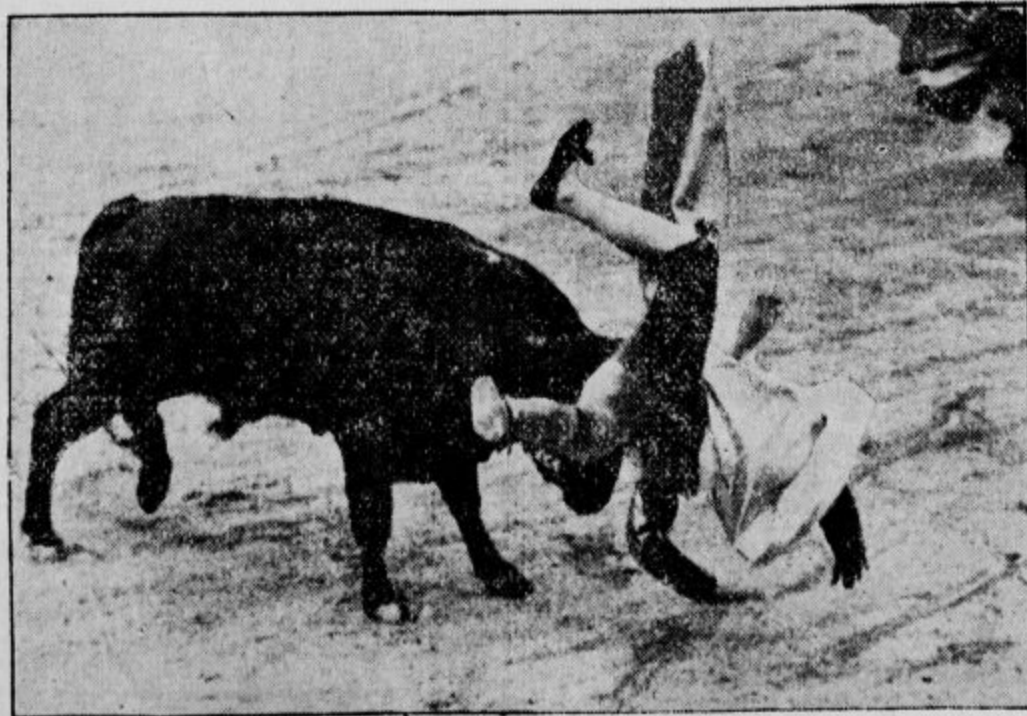
Španska bikoborba. Sloveči borilci z biki gde. Paimemo v Madridu se je zgodila tale nezdoda.

Veliki katoliški politik je bil tudi velik prijatelj katoliškega tiska. Tudi »Slovenec« mora danes obžalovati njegovo smrt, saj je ta plemeniti mož podpiral cilje katoliškega časopisja kjerkoli je imel priliko. Rad se je odzval in je za božično številko predlanskega leta za »Slovenca« napisal lep članek. Spomin na tega katoliškega moža bo tudi med katoliškimi Slovenci trajno ohranjen.