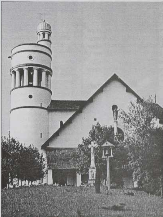
Plečnikova cerkev v Bogojini

Slovenski veleposlanik Ferenc Hajós pa je povedal: "Današnja razstava Jožeta Plečnika - Arhitektura za novo demokracijo, je sporočilo velikega evropskega demo-