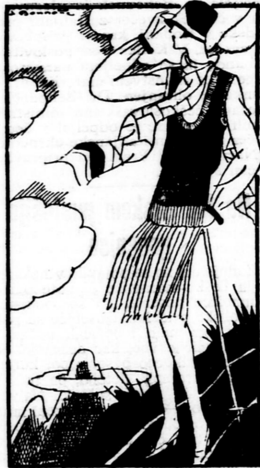
Dama kot nedeljski turist

Ženske, ki so poklicane lajšati in slajšati svoji okolici življenje, bi morale v hudi vročini skrbeti, da postane življenje v stanovanjih, trgovinah, uradih in delavnicah vsaj deloma znosno. Ženska roka lahko vedno pripomore, da se vročina v stanovanju ali lokalu vsaj nekoliko ublaži. Odprta okna lahko zastremo z mokrimi zastori, tla je treba večkrat čez dan poskropiti s hladno vodo, tam, kjer imajo parkete, pa lahko postavijo v sobe posode s hladno vodo. Velikega pomena je v hudi vročini tudi hrana in pijača. V pasjih dneh je treba črtati z jedilnega lista vse jedi, ki jih je treba dolgo kuhati. Skrbna gospodinja prinese v hudi vročini na mizo samo lahka, po možnosti mrzla jedila. Salata, surovo sadje in razna mrzla jedila nam pomagajo prenašati hudo vročino. V Angliji, Indiji in Rusiji pijejo v največji vročini vroč čaj. Tudi kratka topla kopel osveži človeka bolj nego mrzla.