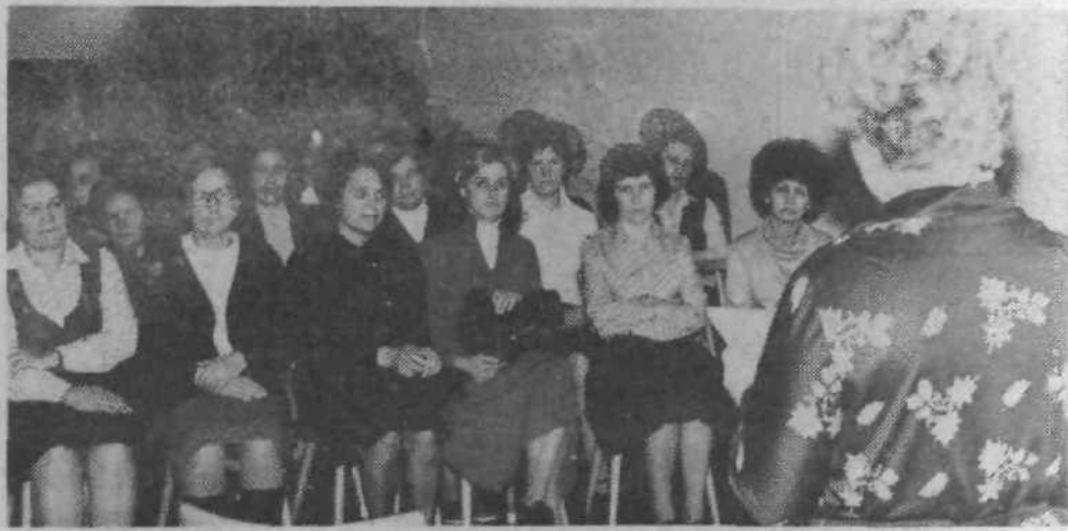
8. MAREC V TIP-TOPU - V tristoosemdesetčlanskem kolektivu Tip-top, ki sicer spada pod novomeški Labod, so osmega marca praznovali dan žena in praznik celotnega Laboda obenem. Da je temu tako, so se odločili, ker ima Labod med 2000 zaposlenimi ker 1500 žensk. Kulturni spored ob dnevu žena so pripravili učenci gimnazije Ivan Cankar, istočasno pa so podelili tudi priznanja ženskam-delavkam za deset, dvajset in več letno sodelovanje v kolektivu.