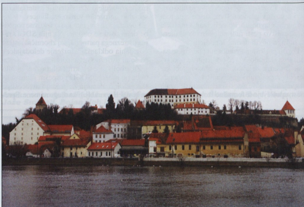
V najstarejšem mestu na Slovenskem se število delovnih mest še vedno zmanjšuje.

Tekstilna industrija, ki je bila včasih na ptujskem območju dobro razvita, je še vedno v krizi. Pred kratkim je moralo v stečaj podjetje Valido, v hudih težavah pa je tudi Valido Stil.