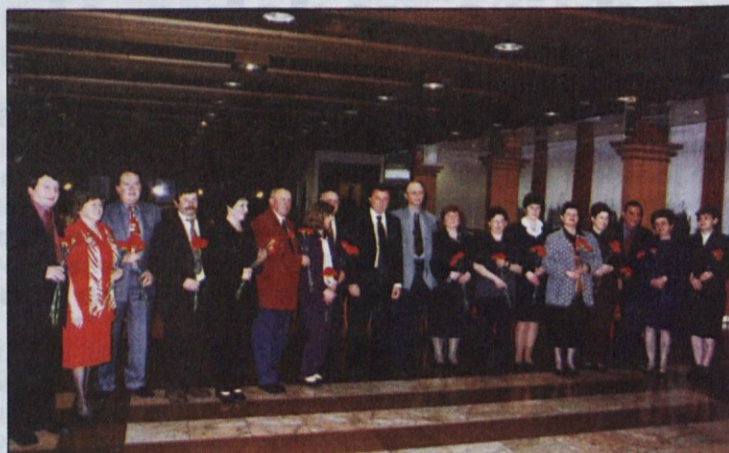
Na članskem sestanku so delovnim jubilentom izročili šopke nageljnov. Predsednik sindikata in predsednik uprave sta ob tem ugotavljala, da je največ tistih s 30 leti delovne dobe.

ček. Nadzorni odbor v poslovanju ni odkril nobenih nepravilnosti.