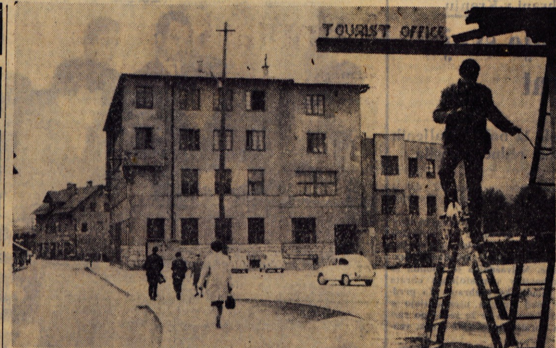
Izletniško podjetje ITA si je na Cesti maršala Tita na Jesenicah uredilo nov lokal, ki ga bodo otvorili v prihodnjih dneh. Za lokalom so uredili parkirni prostor, ki bo predvsem dobrodošel številnim voznikom, ki prihajajo po opravkih na občinski ljudski odbor ali na upravo carine

... je ukinjen 50 odst. občinski prometni davek na račun