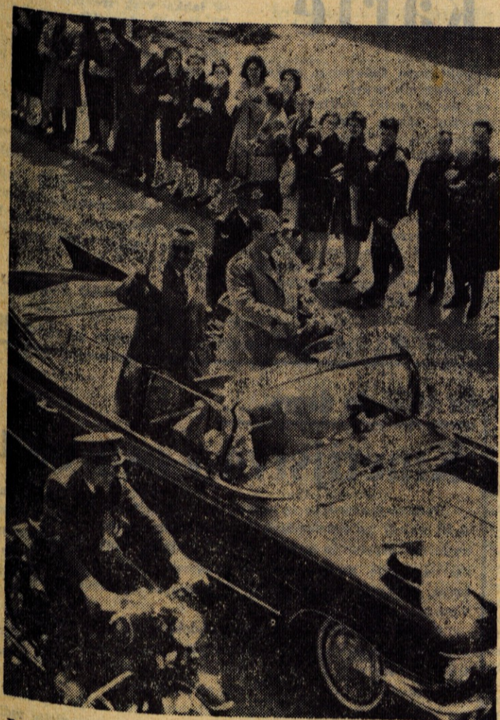
Predsednik Združene arabske republike GAMAL ABDEL NASER, ki je v nedeljo prišel na uradni obisk v SFR Jugoslavijo, je večer popoldne v spremstvu predsednika TITA prispel na Brdo. Vzdolž vse poti od Pulja, skozi Ljubljano in Kranj je visoka državnik pozdravilo na desetisoče ljudi. Predsednika sta jim odzdravljala iz odprtega avtomobila.