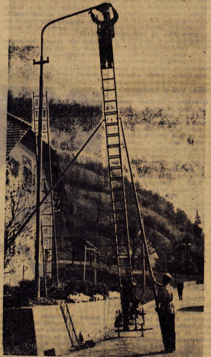
V Gorenji vasi so te dni urejali cestno razsvetljavo

Na razstavi, ki bo ves teden odprta od 9. do 19. ure, bodo obiskovalci lahko poslušali tudi strokovno razlago. — St. S.