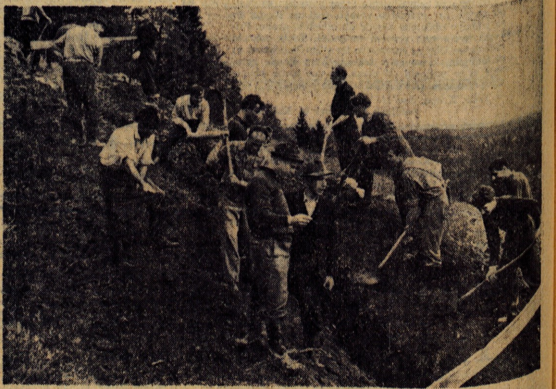
Na pobočju Jošta gradijo Besničani s prostovoljnimi delom glavni vod