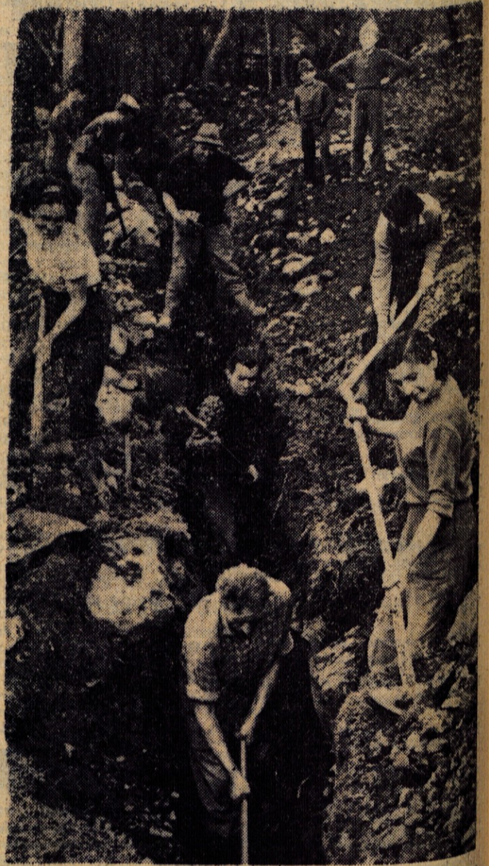
Izkop na Lancovem je naporen — samo kamenje in skala

Med našim pogovorom se je zbrala ob edinem vodnjaku na Lancovem kar lepa skupina gospodinj s škafi in svitki. — Čakale so v vrsti na vodo. Med