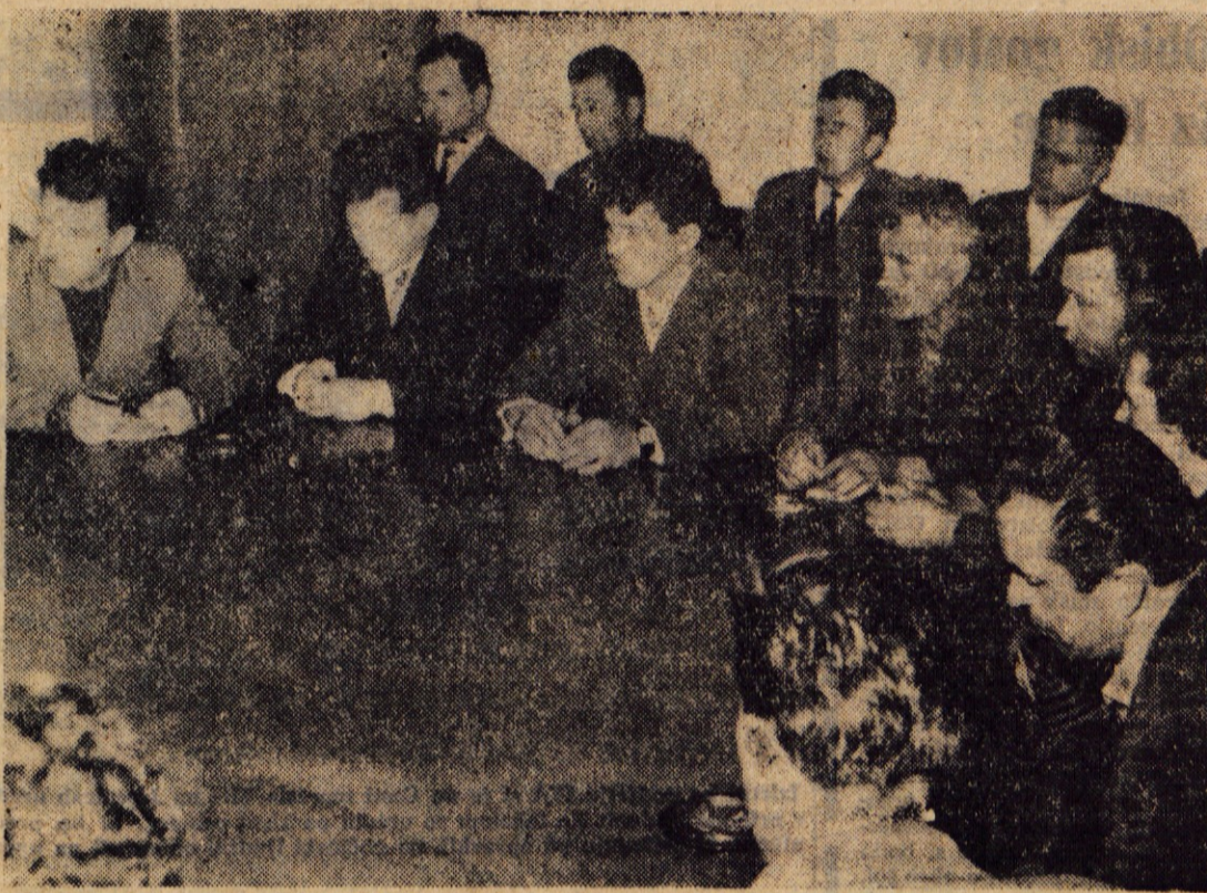
Del kandidatov za zbor delovnih skupnosti med pogovorom

Radovljica — V krajih radovljiške občine se pridno pripravljajo na praznovanje dneva mladosti in stoletnice Rdečega križa. Sote bodo priredile samostojne šolske proslave in javne nastope, športna tekmovanja in prireditve »Pokaži, kaj znaš«. Ponekod bodo praznovanje dneva mladosti povezali s počastitvijo 10-letnice RK. V ta namen prireajo tudi tečaj prve pomoči za člane podmladka. Mlade absolvente osmih razredov bodo slovesno sprejeli med člane RK. V dneh praznovanja mladosti se bodo pionirji in mladinci pomenili tudi na posebnih prireditvah pred javnostjo MLADINA PRED MIKROFONOM ; pripravljajo pa se tudi mladi igravci, glasbeniki, recitatorji, pevski zbori, instrumentalne skupine in drugi. — J. B.