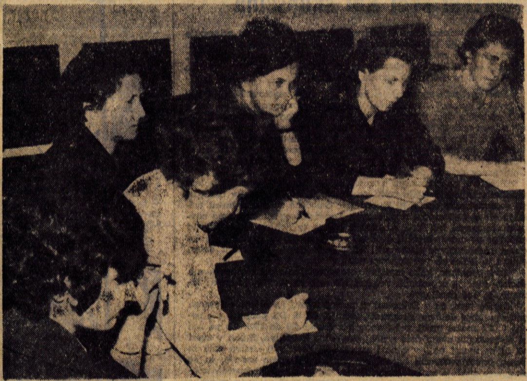
Del kandidatov za občinski zbor, kjer bodo, kot se obeta, tudi žene zastopane v večjem številu

Razgovor je bil izredno živahen in ploden. Največ se je razprava sukala okrog organizacije in dela