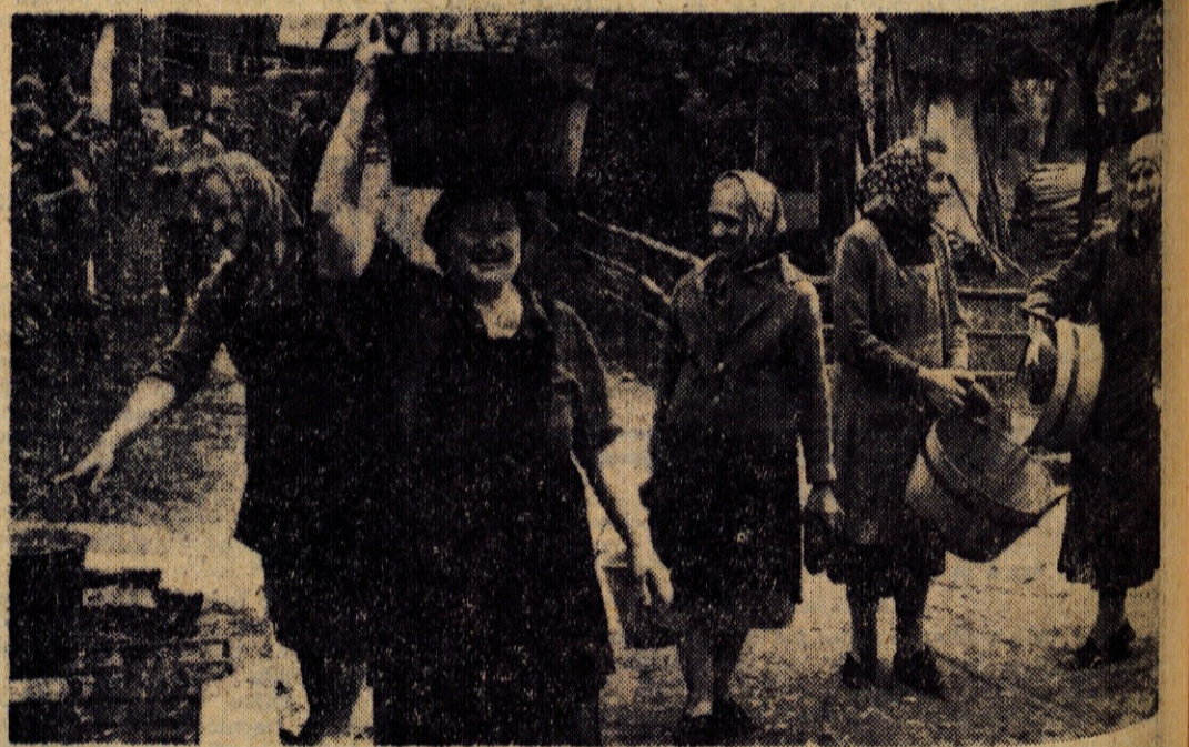
Gneča pred edinim vodnjakom na Lancovem. Upajmo, da bo v kratkem konec borbe za vodo