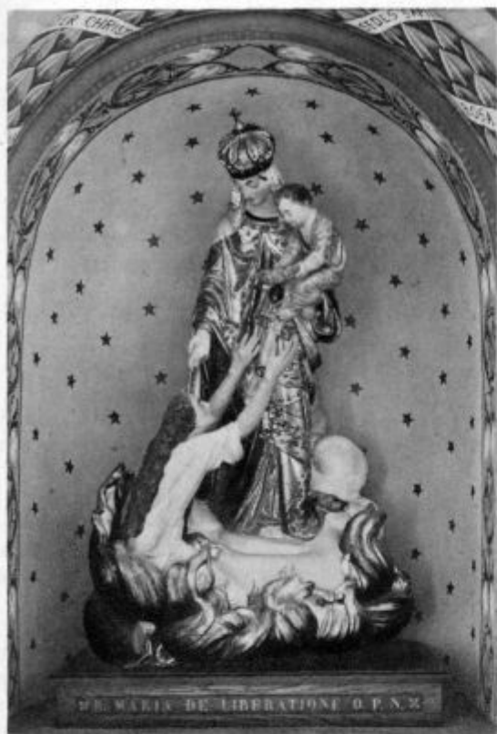
Samostan oo. trapistov: „Marija Rešiteljica“

Je že kje oboje staro našel, si je mislila gospa Marija in prilila kropa. —