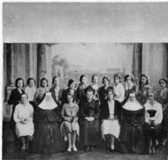
Akademičarke, ki so se udeležile duhovnih vaj pri uršulinkah v Ljubljani

ga ni več skrbelo. To je tudi vedel, da se pri »mea kulpa« rado preobrne tako, da se začne zopet od kraja. Zato se je zlasti začetne besede, ki vodijo v drugi del, prav dobro zapomnil. Tiste besede je vedno bolj glasno in