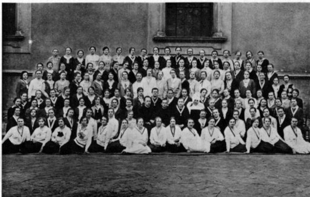
Slovenska Marijina družba v Zagrebu

Res nismo imeli tisti hip nobenega dijaka v šolah. Nadarjeni mladeniči, ki bi imeli vrhu tega še poklic za duhovno pastirstvo, pa tudi ne rastejo za vsakim grmom. Z mirno vestjo bi bil z nabranim denarjem lahko podprl kateregakoli do-