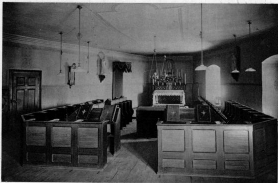
Samostan oo. trapistov: Kapela

»Lahko bi ga, nič ne rečem. Tudi rekli bodo lahko, da so ga. Kdo naj pa verjame današnjemu svetu?«