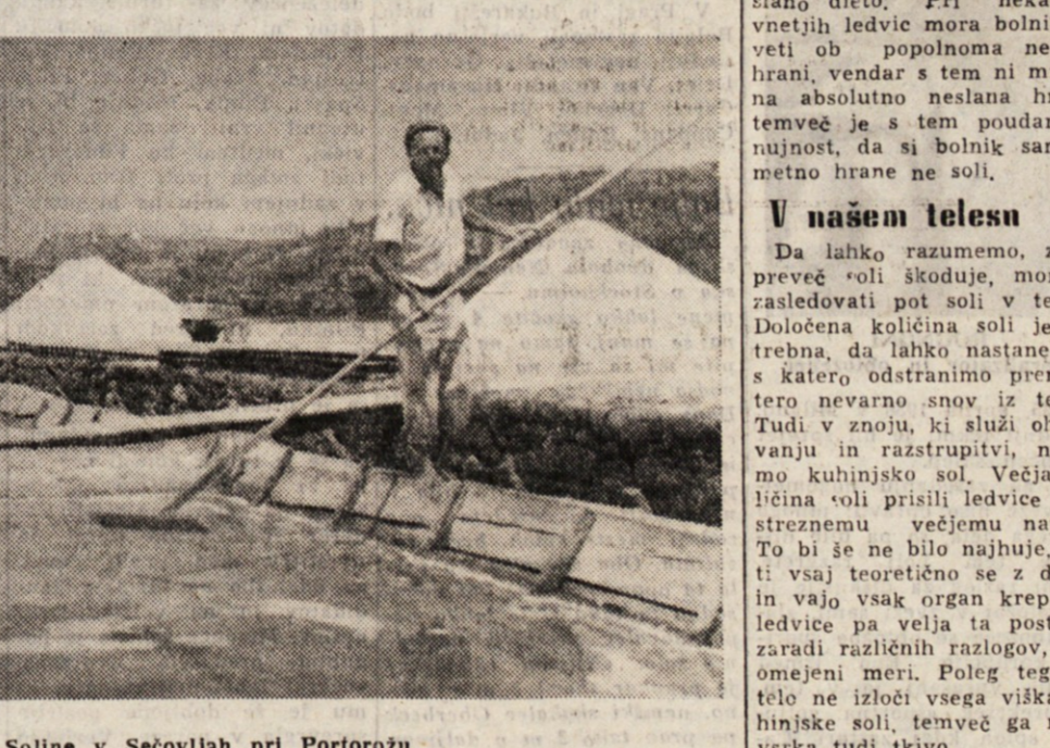
Solne v Sečovljah pri Portorožu

V Italiji obstaja deset odprtih zavodov, dasi ni mogoče, kajti v Zenevi imajo sodni zavodi. Na kongresu v Haagu leta 1950 so te zavode označili na sledeči način: 'Kazniški zavodi, pri katerih preventivni ukrepi proti pobegu ne leže v materialnih ovirah; skratka: pripornike ne ovirajo visoki zidovi, rešetke, zapani ali strogo in stalno nadzorovane čuvaje; oni so znotraj in na besedi. V mnogih državah se so odprti zavodi dobro obnesli. Kongresisti so obiskali v Svici odprti zavod v Witzwilu.