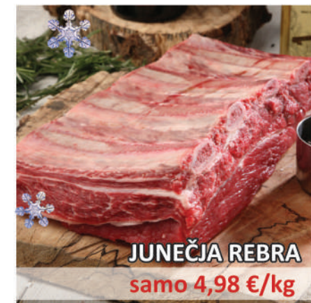
JUNEČJA REBRA samo 4,98 €/kg