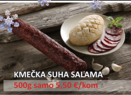
KMEČKA SUHA SALAMA 500g samo 5,50 €/kom