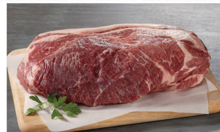
SVINJSKI VRAT BK 4,98 €/kg