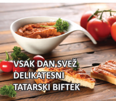
VSAK DAN SVEŽ DELIKATESNI TATARSKI BIFTEK