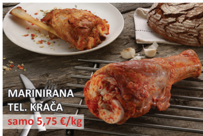
MARINIRANA TEL. KRAČA samo 5,75 €/kg