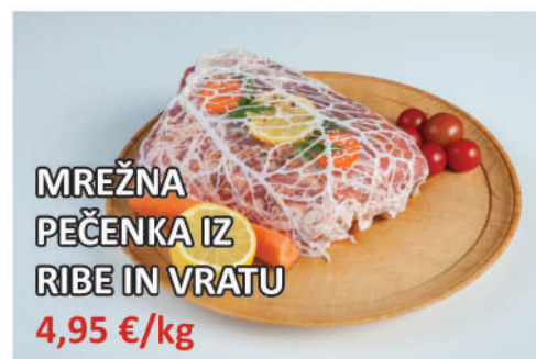
MREŽNA PEČENKA IZ RIBE IN VRATU 4,95 €/kg