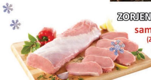
ZORJENA SVINJSKA RIBA samo 5,95 €/kg (ZA TOPLOTNO OBDELANE JEDI, KOT SO DUNAJSKI ZREZKI, PEČENKA ...)

V PONUDBI TUDI ZORJENI RAMSTEAKI, RIBEYE STEAKI, FILE MIGNON, T-BONE, TOMAHAWK, ZORJENO TELEČJE STEGNO in še mnogo več. VSE ZA KOLINE, VSE VRSTE DROBOVINE, KOCKANA HRBTNA SLANINA, KRI in ČREVA.