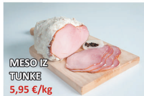
MESO IZ TUNKE 5,95 €/kg