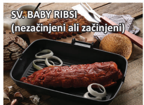
SV. BABY RIBSI (nezačinjeni ali začinjeni)