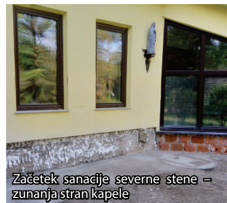
Začetek sanacije severne stene – zunanja stran kapele