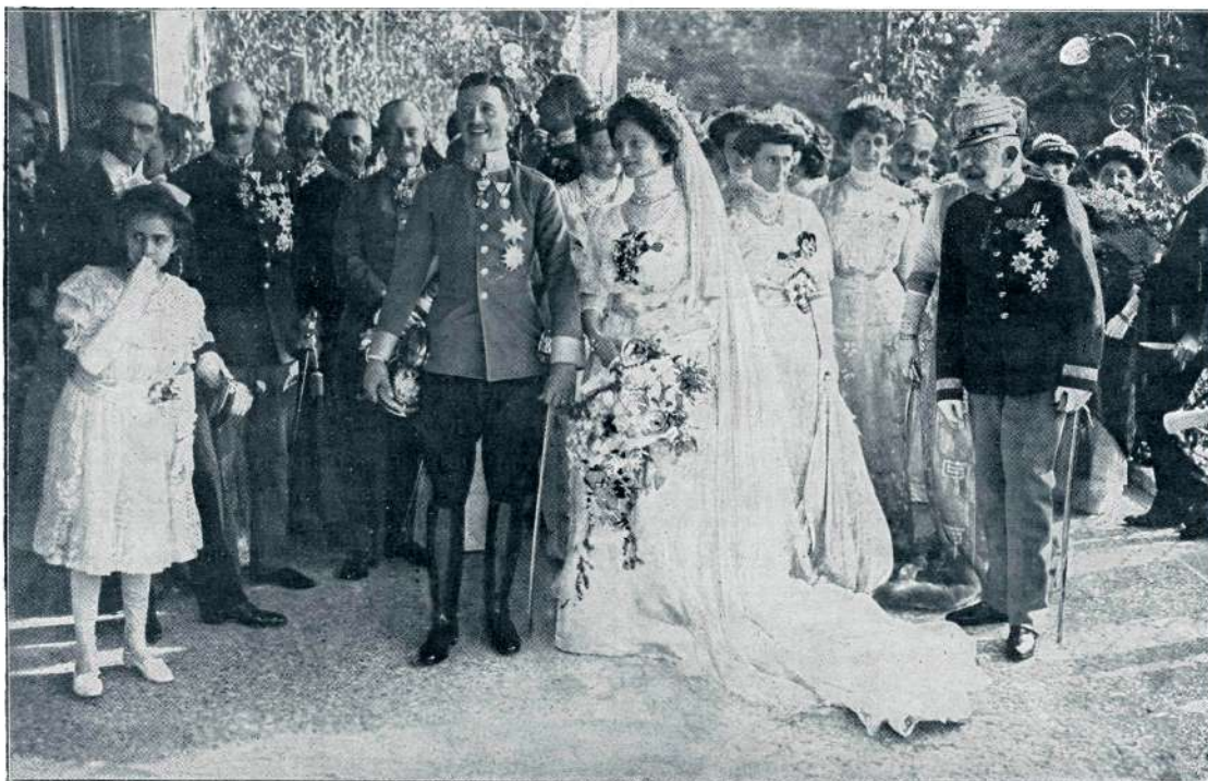
POROKA V CESARSKI HIŠI: FRANC JOŽEF I. IN NOVOPOROČENCA NADVOJVODA KAROL FRANC JOŽEF, BODOČI PRESTOLONASLEDNIK, Z NEVESTO CITO NA ALTANI

O ljudstvo oberammergausko! Čuvaj in brani skrbno dragoceni zaklad, ki si ga rešilo iz srednjega veka! S ponosom lahko gledaš nazaj, brezskrbno lahko gledaš naprej . . . Križ na gori je razpel svoje roke in te objel. Njegova ljubezen ostane do konca . . .