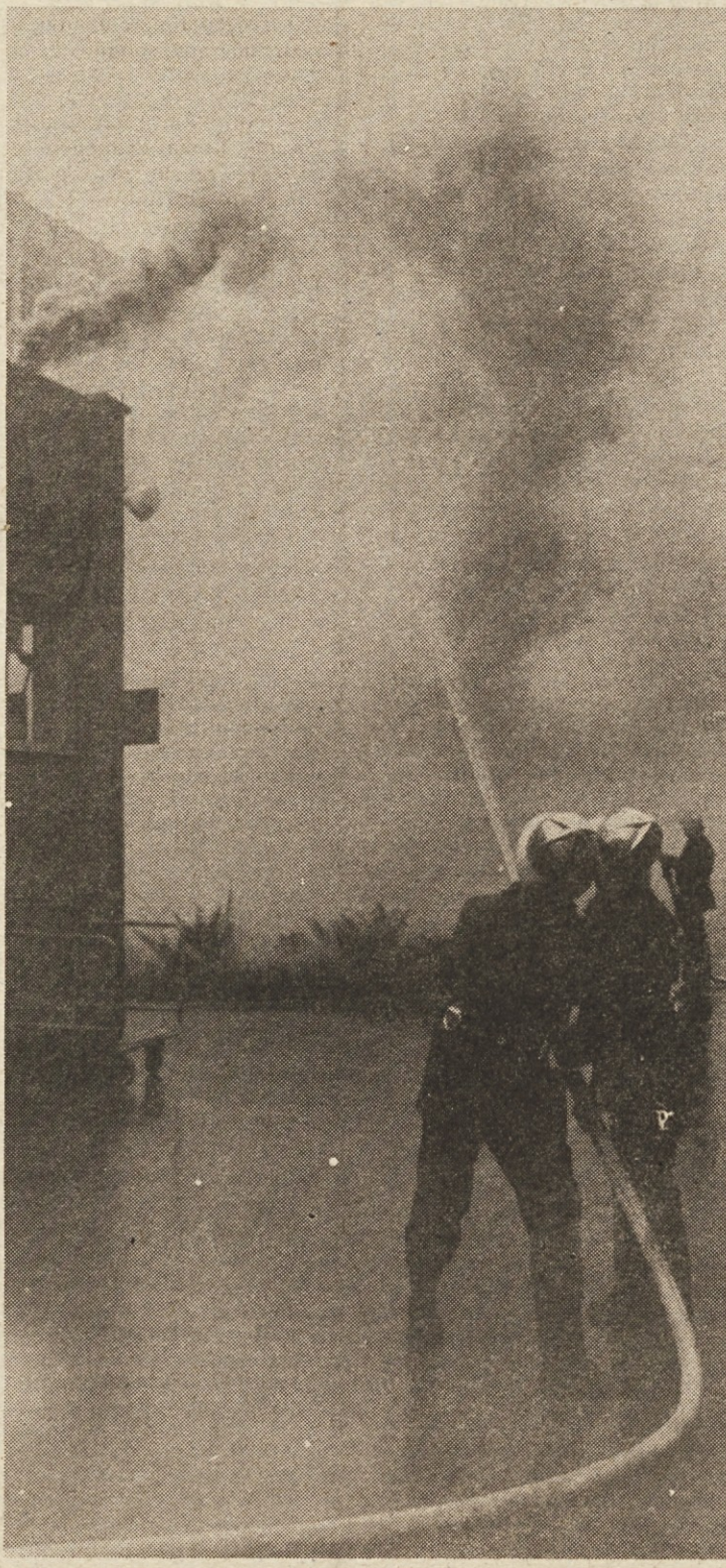
Gasilska enota pod vodstvom Dušana Okorna je izvedla dvojni napad na ogenj, ki je »izbruhnil« na strehi kuhinje.