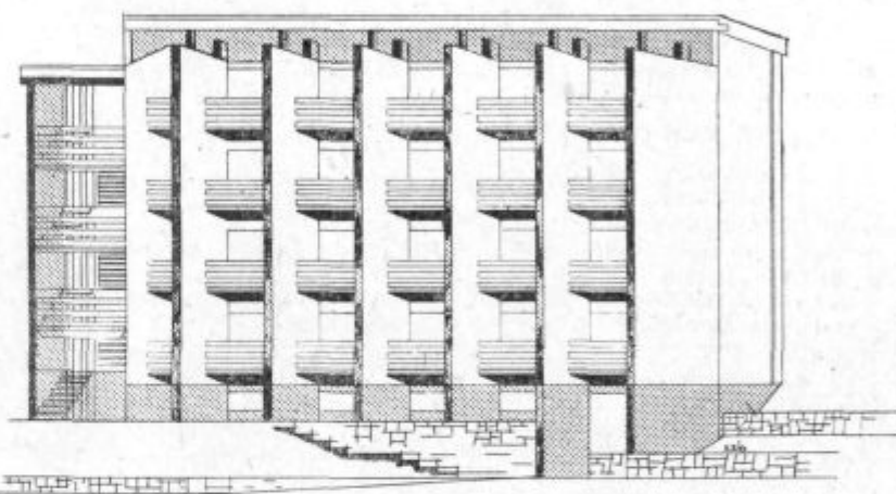
Novozgrajeni počitniški dom v Fiesi

Proračunska vrednost objekta znaša 32,0 milijonov din, vrednost novozgrajene ceste 926.000 dinarjev, ureditev okolice — zelenice in parkirnih prostorov znaša 300.000 din. Kljub oviram, ki so jih delala razna podjetja in lastniki domov v okolici, je bila stavba zgrajena do 6. maja. Okolica s cesto in parkirnimi prostori pa je bila urejena do 20. maja.