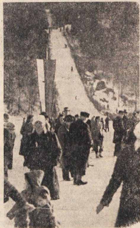
Tradicija vsako leto privabi številne gledalce k šentjanski skakalnici

tev po vsem Koroškem je bila udeležba tek je lahko dejstvo, da tudi ostale prireditve ni-movalcev letos žal manjša kakor vsa prejšnja leta in gledalci, ki jih je bilo preko tisoč, za-to niso prišli tako stoočstno na svoj račun. V zadoščenje prirediteljem in gledalcem pa so mogle zabeležiti nič močnejše udeležbe. V Reichenfelsu, ki si je koroško skakalno elito delil z nami, ni pa imel inozemskih tekmo-valcev, je bilo na primer na startu samo 15 tekmovalcev, dočim jih je bilo pri nas skupno 17, med temi trije Jugoslovani in dva Ita-