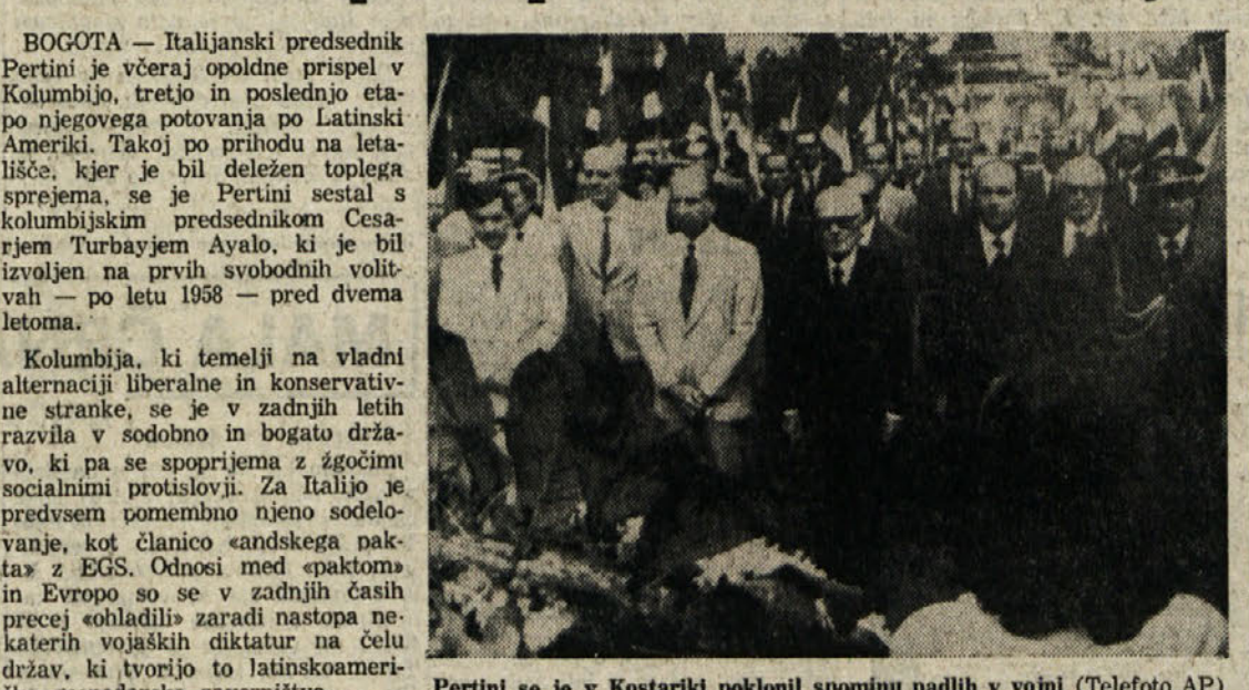
Pertini se je v Kostariki poklonil spomenu padlih v vojni