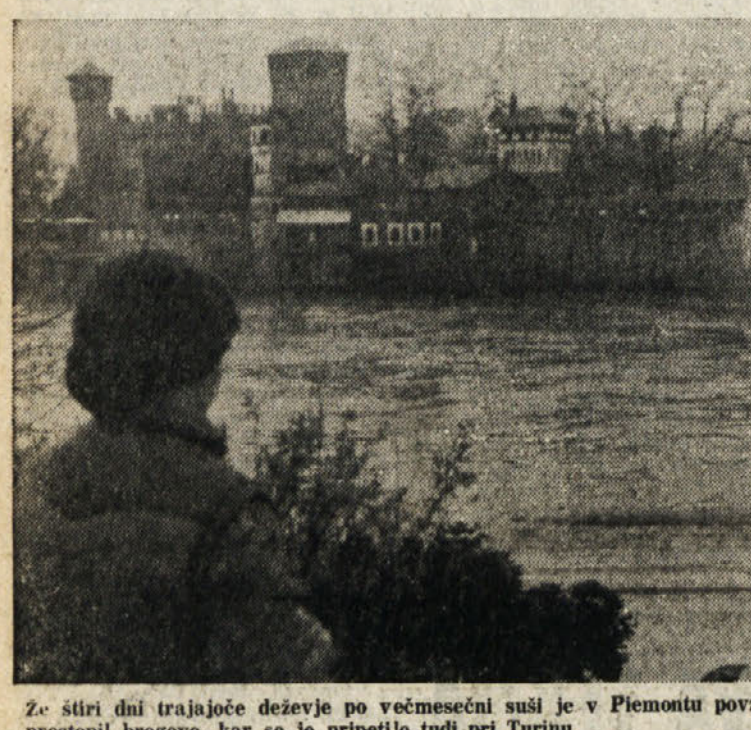
Ze štiri dni trajajoče deževje po večmesečni suši je v Piemontu povzročilo hude zaplete. Pad je marsikje prestopil bregove, kar se je pripetilo tudi pri Turinu.