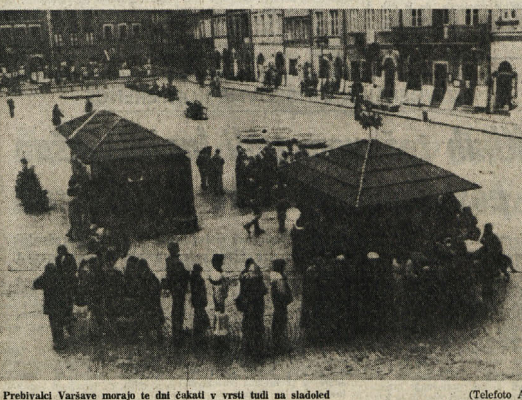
Prebivalci Varšave morajo te dni čakati v vrsti tudi na sladoled

Odstop dveh članov komisije - Walesi ocitajo, da se premalo zanima za sindikalne zadeve - Številne pobude v zahodni Evropi za dobave hrane poljski državi