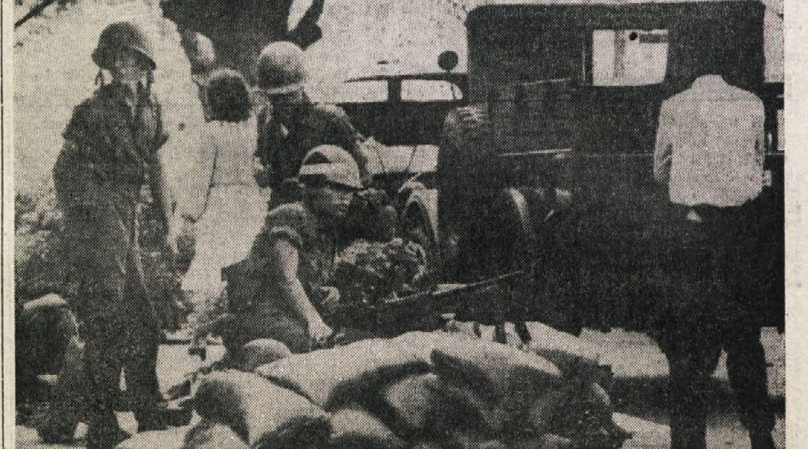
Kaže, da si prebivalci Bangkoka ne ženejo pretirano k srečo varnostnih ukrepov po državnem udaru