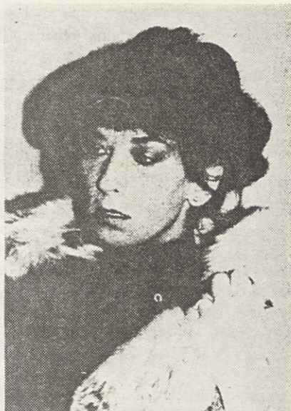
PESNICA IN PISATELJICA, SVETLANA MAKAROVIC

Danes živi kot svobodna književnica na samotnih Korpah pri Lukovici. Piše pesmi in prozo ter radijske in lutkovne igre za otroke.