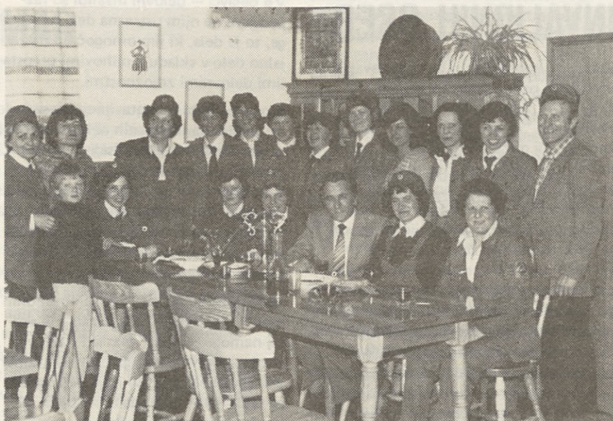
OB KONCU SO ZDRUŽILI MOČI