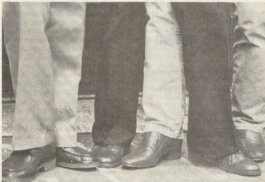
HLAČE, HLAČE — UDOBJE

Pri vsem upamo, da ne bodo nastopile težave pri dobavi surovin in da bo vsaj do začetka proizvodnje artiklov za po-