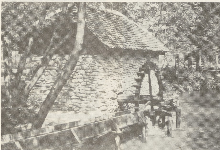
PLANSKO RAZVIJAJMO TUDI TURIZEM ...

Del svojega razvoja bomo dosegli izven gospodarskega prostora občine Mozirje. Kolikšen bo ta del, pa bo odvisno od mnogih činiteljev. Brez dvoma bo preskrba s surovinami, ki je tudi tesno povezana z našim izvozom. Kolikor več bomo izvažali, toliko več bomo lahko uvažali in toliko hitreje se bomo razvijali.