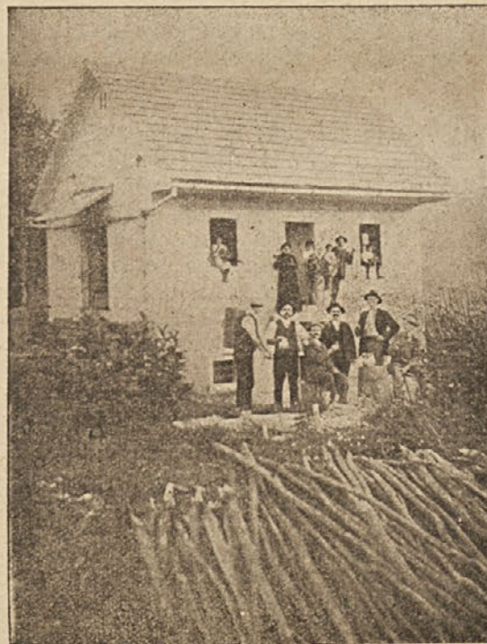
Martinovanje dolenjskega vinogradnika.