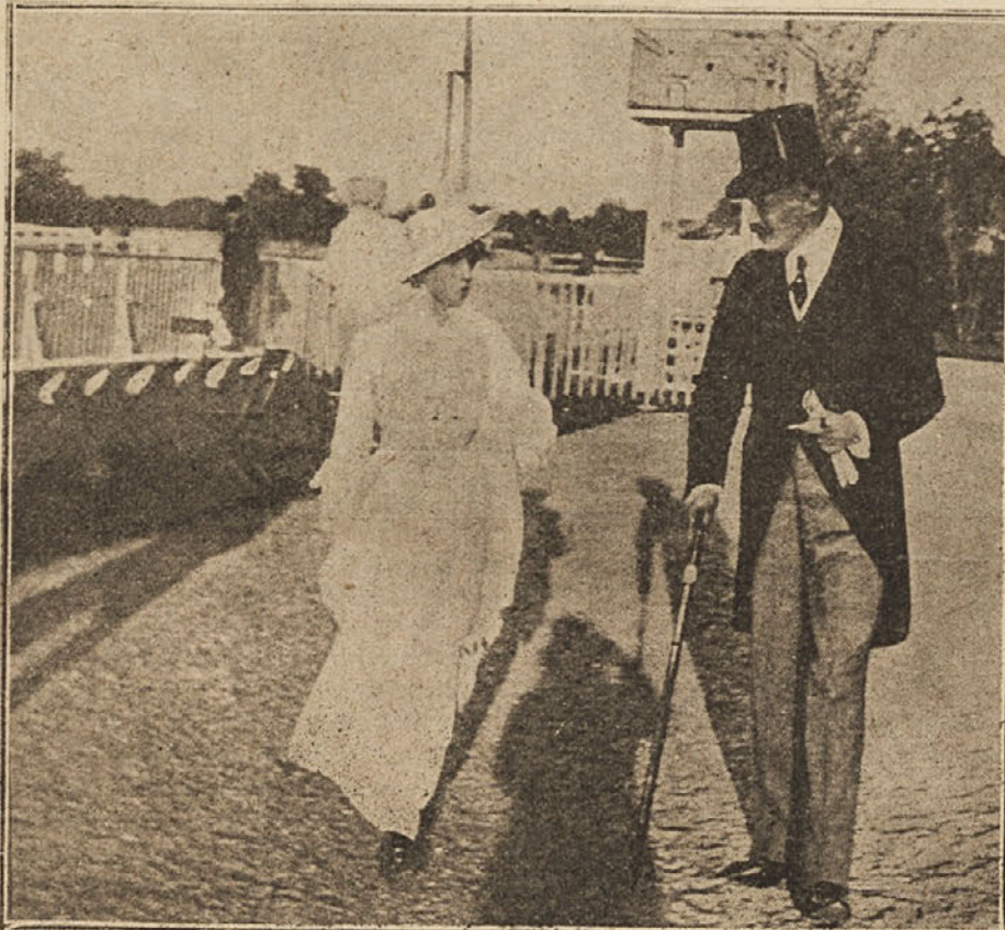
Česa je manjkalo Arnavtom: Princ Viljem Wiedski, ki postane najbrže knez „neodvisne“ Albanije, s svojo soprogo Sofijo.

prej ko slej neutržno za racionalno oskrbo polti in lepote. Priznanostna pisma. Po 80 h povsod.