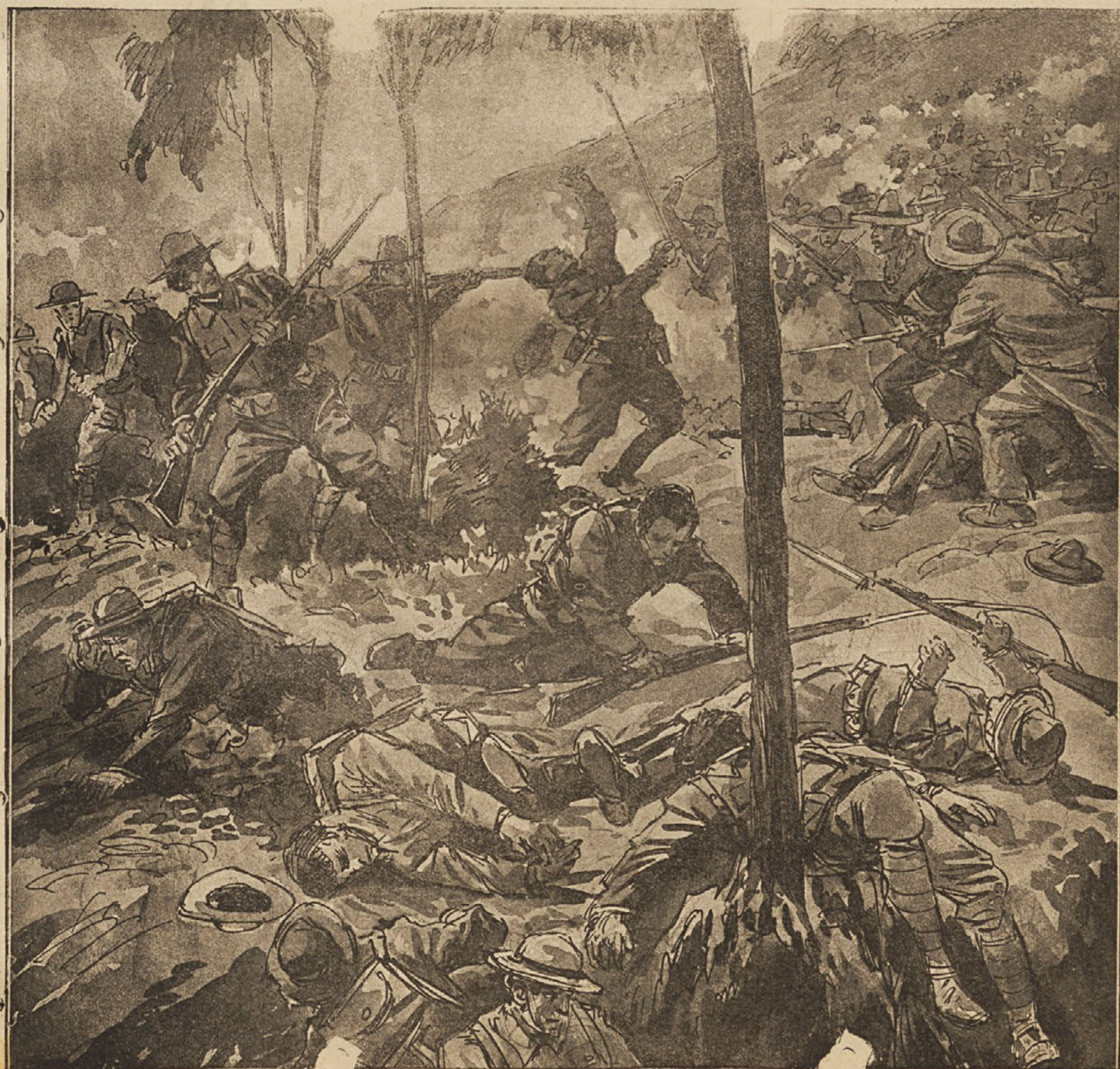
700 zveznih vojakov je bilo v Santa Clari napadenih in poklanih po vstaših.