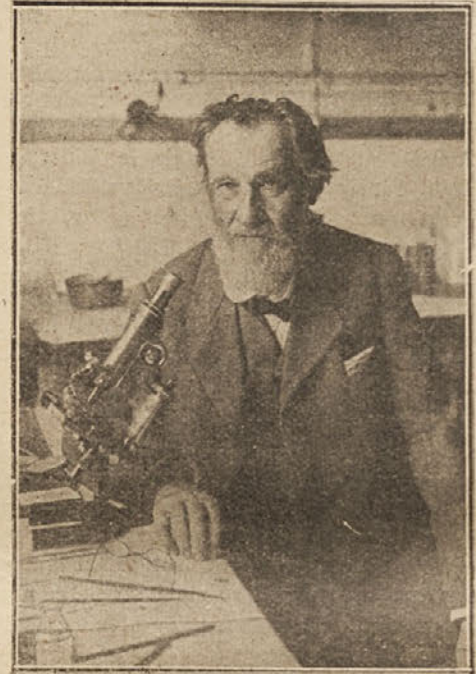
K boju proti steklini: Sloveči ruski bakteriolog, profesor Mečnikov, sedanjí ravnatelj Pasteurjevega zavoda v Parizu.

„Dajte luč!“ je viknil tovarišem, ki so bili zadaj.