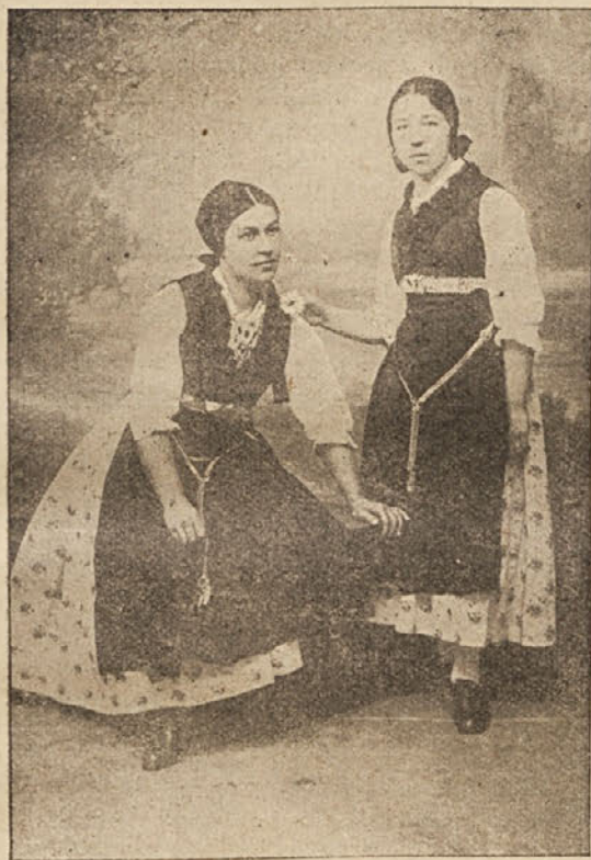
Slovenske narodne noše: Dekleti iz Rožne doline na Koroškem.

„Zdaj smo res oti!“ si je oddahnil Estournelle z nemajhnim zadovoljstvom. „Bogme, rajši pustim svojo kožo kjerkoli, nego tu, da bi me glodale podgane morda še polživega...“