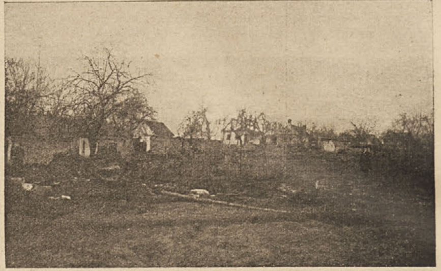
Dne 13. t. m. je divjal v vasi Brod pri Novem mestu požar, ki je upepelil poslopja sedmim gospodarjem. Pogled na pogorišča.

ladij, med njimi 16 severoameriških, 1 francoska in 3 nemške. Dve veliki angleški križarki sta dobili povelje, da odploveta v mehikanske vode. V vsej Mehiki se vrše krvavi boji med zavezniškimi četami in vstaši.