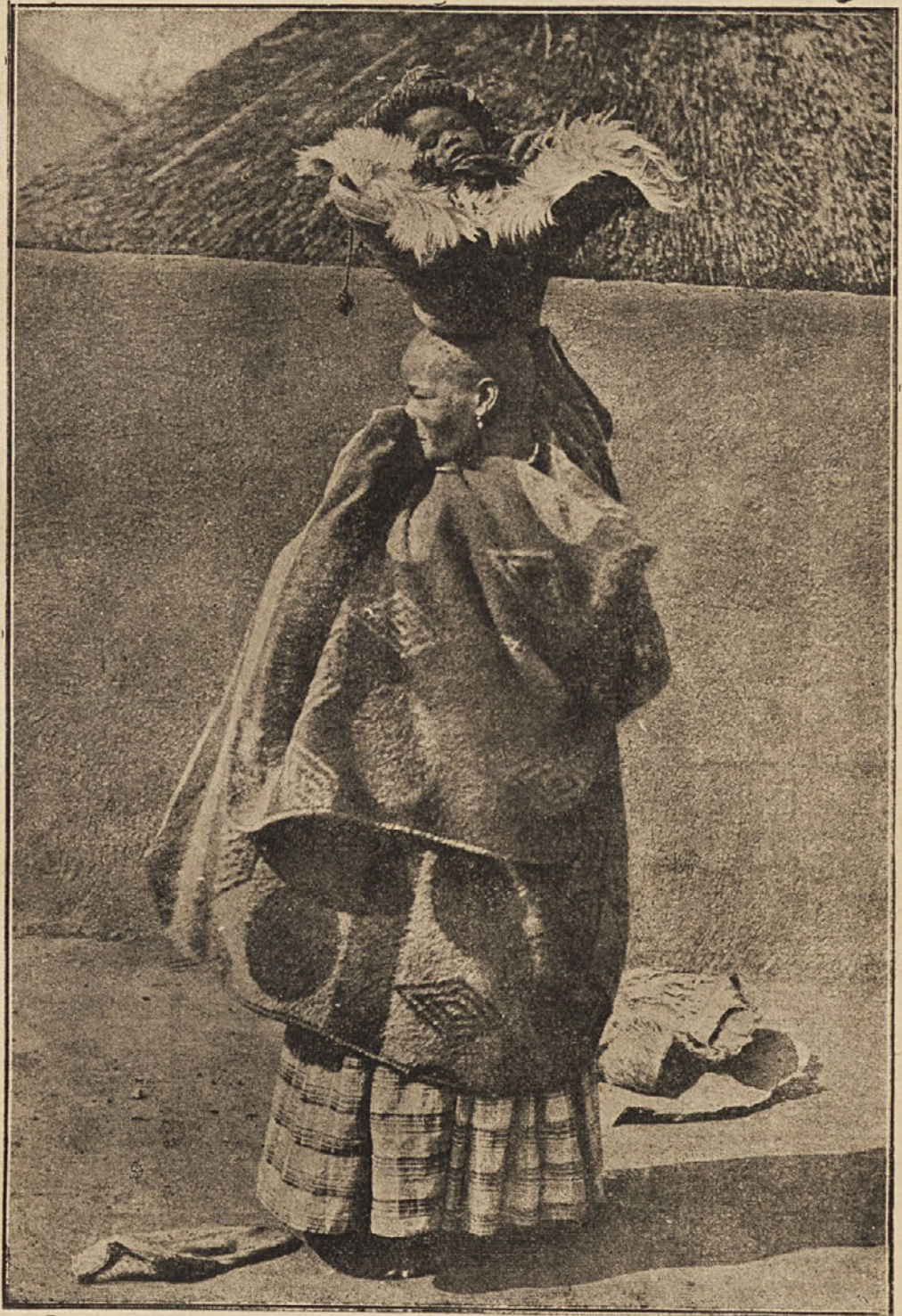
Materinstvo na drugem koncu sveta: Indijanka iz južnoameriške države Peru, kjer nosijo domačinke dete v naglavnem jerbasu, postlanem s kožami.

uspešno premagal berolinski inženir Lilienthal. Napravil si je peruti, ki so od enega konca do drugega merile 7 m. Sam je tičal v obroču, ob katerem so bile peroti pritrjene. S to napravo se je spuščal Lilienthal s pobočij raznih hribov na tla, toda le pri slabem vetru; pri močnem vetru si ni upal leteti po zraku; močan veter bi ga bil lahko nepričakovano zadel na peruti od zgoraj in ga vrgel ob tla. Dvigniti se Lilienthal s svojo napravo ni mislil, vendar ga je ugoden veter nekaterikrat dvignil nad mesto, s katerega se je spustil v nižavo. Pri letanju je bil Lilienthal prav previden, vendar so ga njegovi poizkusi stali življenje. Ne-koč je med letanjem z največjo silo priletel na