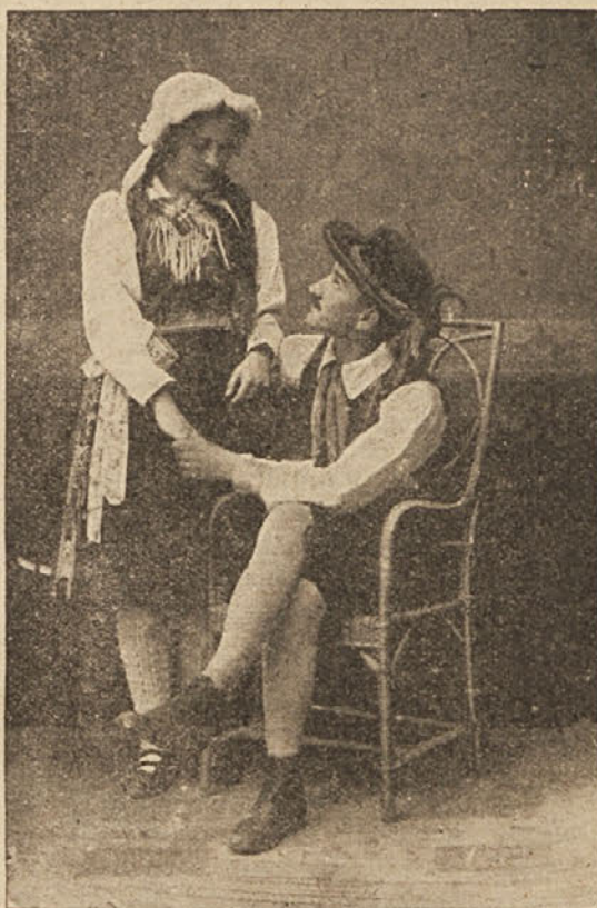
Slovenske narodne noše: Dekle iz Ziljske doline

slal kočijo nasproti! To mora biti pa res že velik prijatelj z zaptijami...“