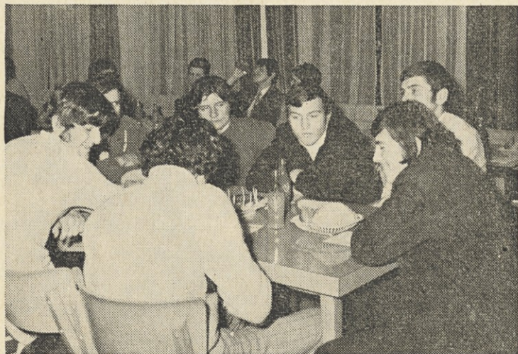
Skupno reševanje problemov mladine in naših študentov, to je želja mladinske organizacije kot tudi kluba študentov. Upamo, da je led prebit.