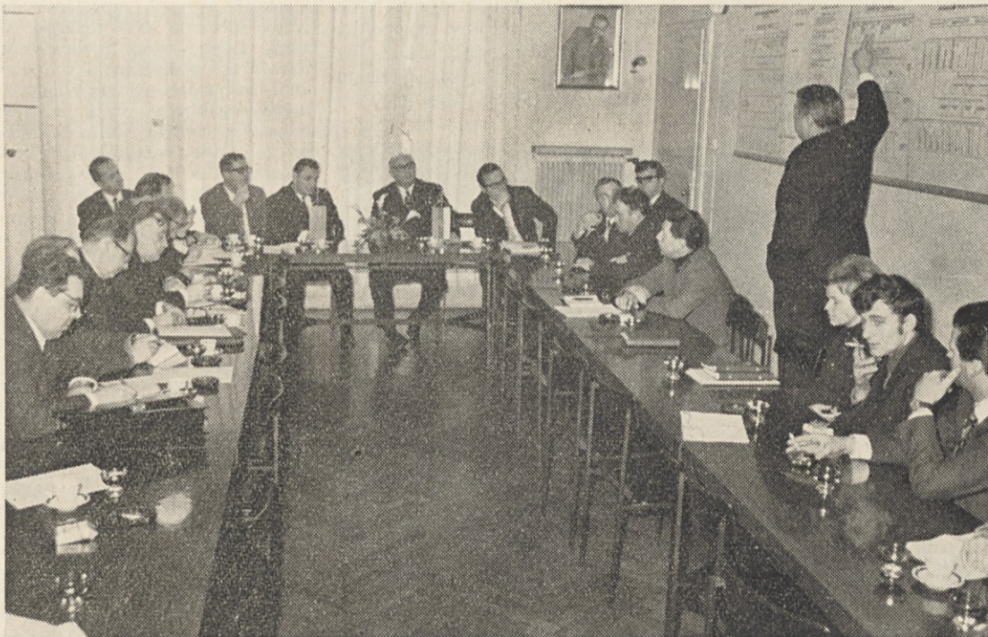
Goste iz SZ smo seznanili, kako poteka samoupravljanje pri nas.