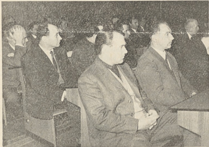
Komunisti SAVE so opozorili na nekatere pomanjkljivosti v tezah za 18. sejo CK ZKS