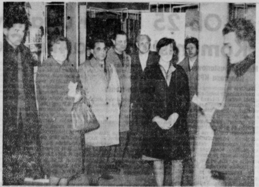
Ob otvoritvi razstave »Mladina v revoluciji in izgradnji« v Ptujju

Razumljivo je, da šola kakor tudi vsi ostali prosvetni organi v občini ne bodo v tej akciji uspeli, če ne bo pravega razumevanja pri posameznih podjetjih, da ne bi z raznimi izgovori dela zavirali, ampak da bi bili pripravljeni nuditi v tej važni in odgovorni nalogi vsi pomoč. Mislimo, da ni to samo naloga prosvetnih delavcev, pa tudi ne prosvetnih organov in ljudskega odbora, ampak da je to naloga vseh naših državljanov, da prispevajo in pomagajo po svojih močeh, da bo delo doseženo v taki meri, kakor ga nalaga pred celotno našo družbo zakon o osnovni šoli. S. S.