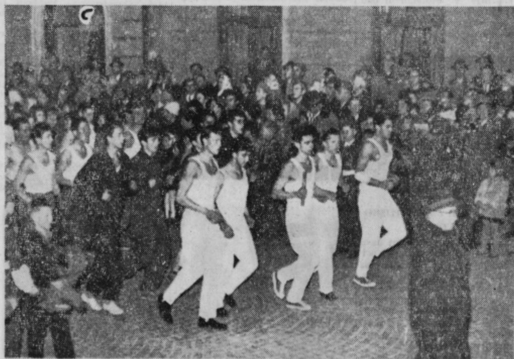
Ptuj ob sprejemu štafet za Titov 70. rojstni dan

Tako bodo prispeli v Beograd za 70. rojstni dan predsednika Tita tudi naši prisrčni pozdravi in najboljše želje zanj in za nadaljnji napredek Jugoslavije in njenih narodov. VI.