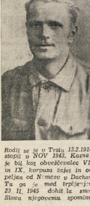
Rodil se je v Trstu 13.2.1910, stopil 11.11.1943. Kasneje je bil kot obveščevalec VII. in IX. korpusa zjet in odpeljan ob N-mecu v Dachau. Tu ga je med trpljenjem 23.11.1945 dohitela smrt. Slava njegovemu spominu!