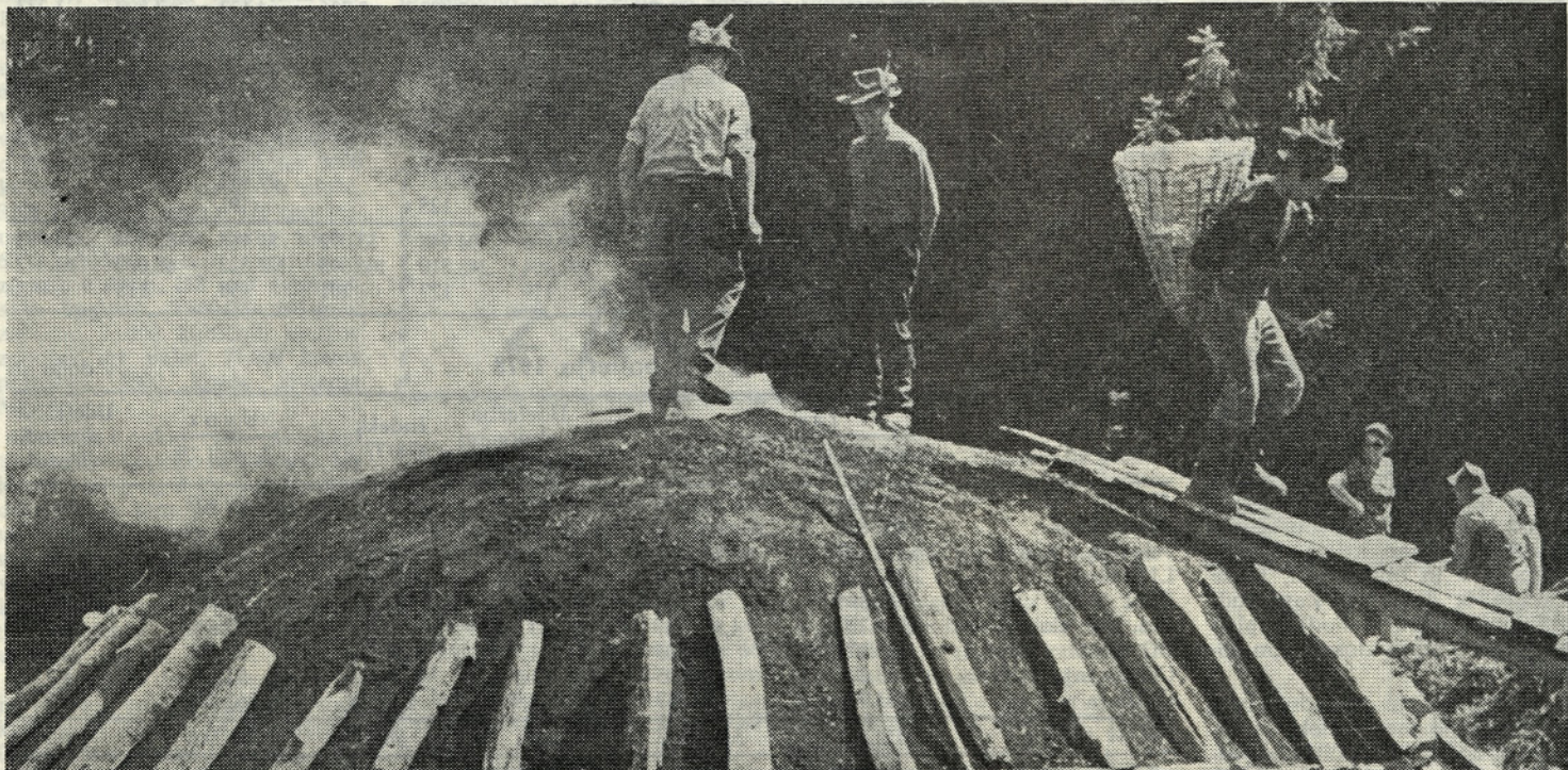
Oglarjenje še ni zamrlo. O oglarskem dnevu, pod pokroviteljstvom GLG, berite na zadnji strani.