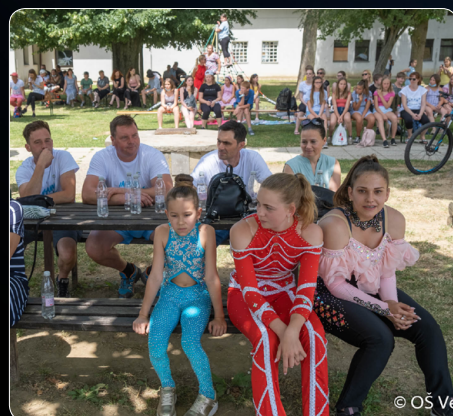
Za vesel in sproščen dogodek so poskrbeli otroci Vrtca Veržej, učenci Osnovne šole Veržej, plesalke plesne šole Urška ter glasbeniki Folklorne skupine Leščeček.