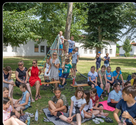
Obiskovalci dogodka Slovenska bakla.